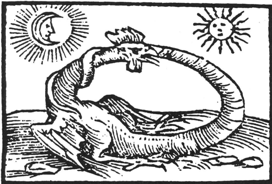
Fig. 1. Da Horapollo, Selecta hieroglyphica , 1597.

Nel medioevo il basilisco subisce anche una metamorfosi somatica e assume l'aspetto di «un gallo quadrupede e coronato, [...] con grandi ali spinose e una coda di serpente [...]». Il mutamento dell'immagine si riflette in un mutamento del nome; Chaucer, nel secolo XIV, parla di basilicock 4 . Si direbbe che la corona, interpretata come una cresta, abbia trasformato l'intero animale in un gallinaceo 5 (con residui ofidici ed eventualmente ali membranose, il che è normale data la sua natura satanica).