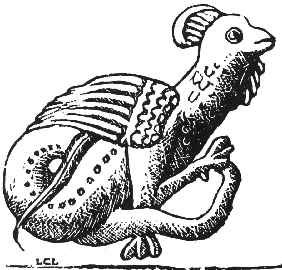
Fig. 3. Scultura della chiesa abbaziale di Vézelay. (Silografia di L. Charbonneau-Lassay.)

nota nel XII sec. a San Bernardo 18 , secondo cui «se è lui il primo a vedere gli altri, questi muoiono subito, se invece sono gli altri a vedere lui, è lui che muore». In altri luoghi il suo sguardo fa perdere la favella (Viganello, Balerna). Oppure incanta, anche da lontano (Carasso), o paralizza la preda (Isona) 19 . I galli basilischi, si diceva nel bacino della Tresa, se li si guarda negli occhi, «lanciano la fisica», espressione che può significare 'fanno una magia, un incantesimo' 20 (e che ci riporta ai tempi in cui le scienze naturali, la «fisica», e la magia erano tutt'uno), ma che il mio informatore interpreta come 'ipnotizzare' 21 .