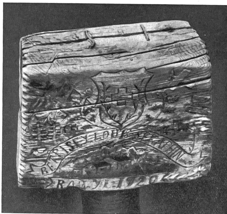
Pō de mulet à l'alpage de Rawyl, face antérieure.

L'alpage du Rawyl occupe toute la partie supérieure du vallon de la Liène. Le chalet principal comprend une cuisine, une grande pièce servant de dortoir et la cave aux fromages;