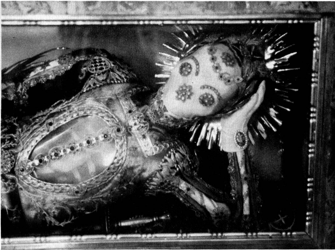
Um unseren Lesern eine Anschauung von den erwähnten Katakombenheiligen zu geben, bilden wir hier den hl. Clemens von Buochs (neugefaßt anfangs des 19. Jahrhunderts) und den hl. Benedikt von Hergiswil ab.