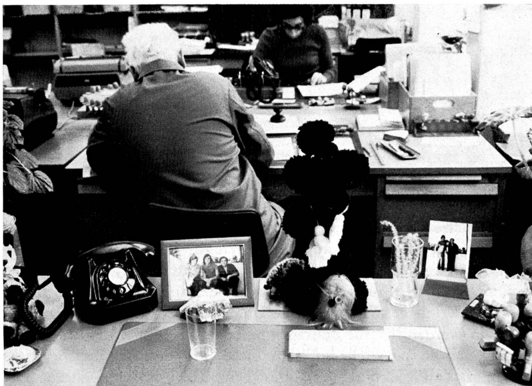
Wir... und unser Arbeitsplatz: Spuren, die zum Menschen führen.