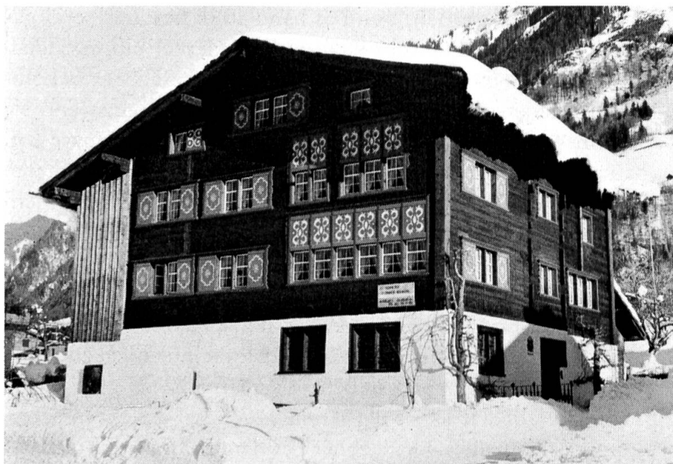
Das Haus des Landvogts Schießer nach der Renovation.