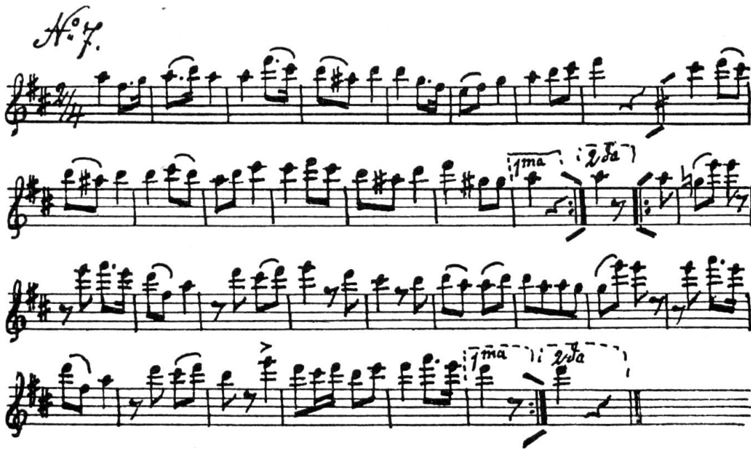
Abb. 1: Aus Basler Trommel-Märsche, eingerichtet von F.BOLLER (Basel um 1850)

Nun bin ich aber kürzlich auf Schnyders Liederbuch für Männerchöre gestoßen 8 . Darin heißt die Nr. 145 «Polka» und beginnt mit «Heiter mein liebes Kind». Als Komponist ist A. Zöllner, als Dichter L. Bechstein angegeben (Abb. 2). Auf den ersten Blick erkennt man, daß es sich um die Melodie des Schlußverses der Neuen handelt.