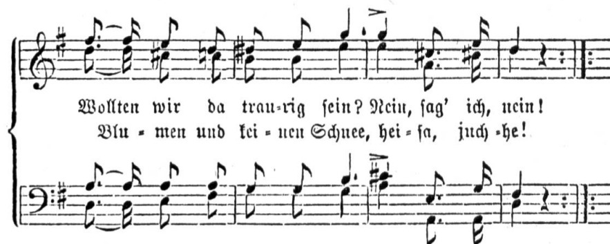
Abb. 2: Aus CHRISTOPH SCHNYDER, Liederbuch für Männerchöre (Zürich 1862)