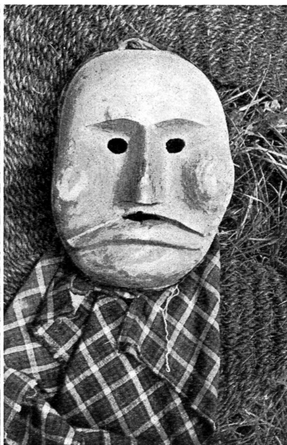
Abb. 6. Unbemalte Tscherler-Larve.