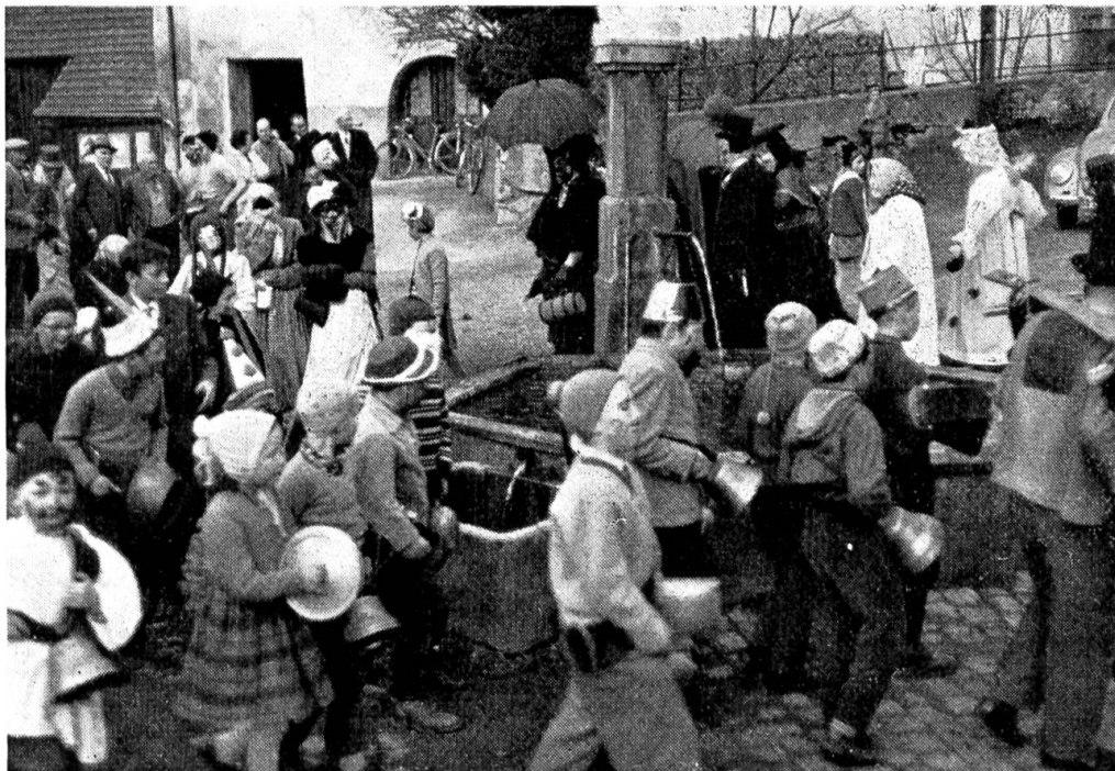
Abb. 4. Um den Dorfbrunnen.