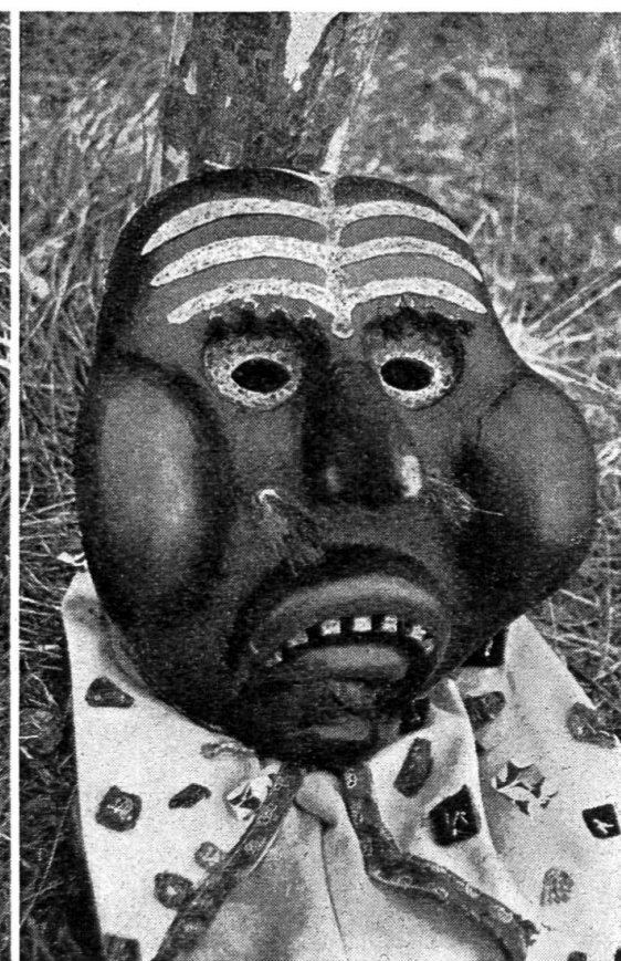
Abb. 7. Holzarve von Zogg-Wohlwend.