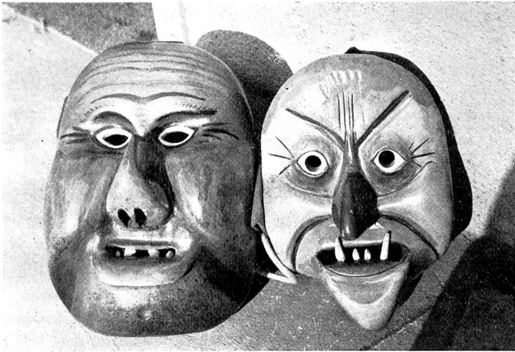
Abb. 3. Zwei Bauern.