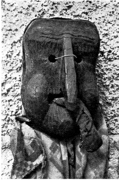
Abb. 5. Teufel.