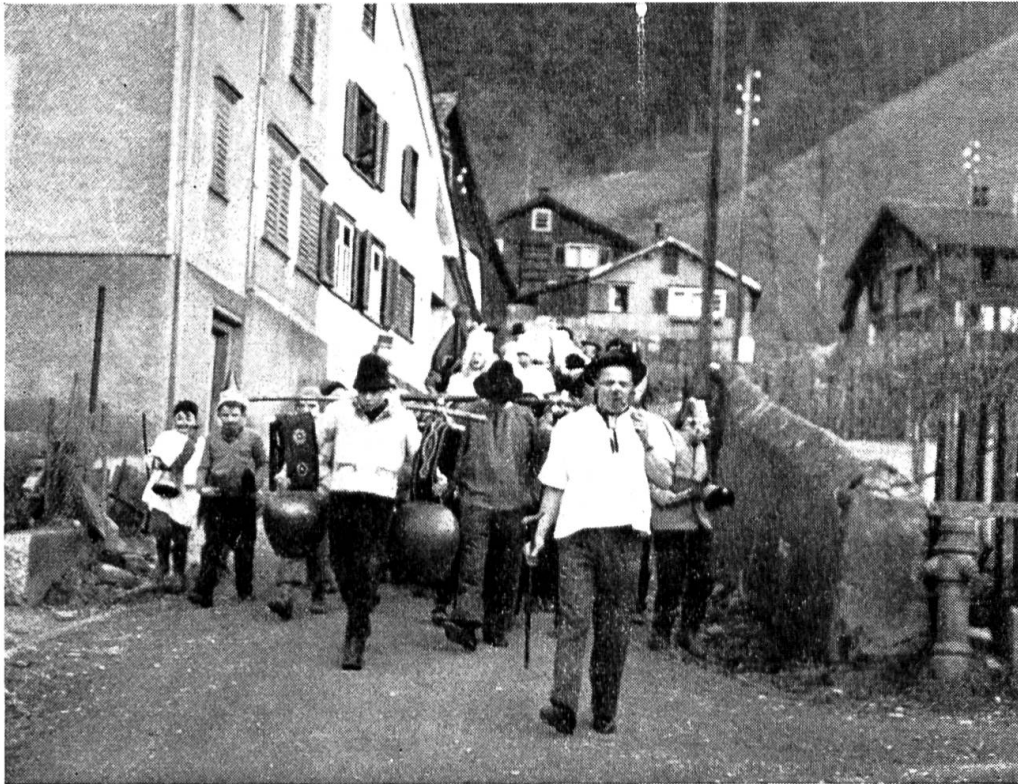
Abb. 2. Der Senn an der Spitze des Umzuges.

Noch vor einigen Jahren trug er eine alte Uniform. Heute trägt er meist ein Futterhemd und die üblichen, festen Bauernhosen. Er bestimmt die Route, marschiert an der Spitze und gibt die notwendigen Kommandos. Hinter ihm kommt die Schuljugend mit Kuhglocken und Pfannendeckeln. Sie führt die Lärminstrumente nicht nur zur Zierde mit, sie macht davon regen Gebrauch. Noch weiter zurück folgen die Butzi, meist «Hudlewiber». Diese Gruppe «butznet» die Zuschauer an und sorgt für den humorvollen Teil in der zusammengewürfelten Schar. Was es da alles zu sehen gibt: Samenverkäuferinnen, Gepäckträger, Köche, eine Frau, die ihren an der Fastnacht verlorenen Mann sucht und sogar ein Ehepaar auf der Hochzeitsreise. Auch der einzige Rölly, über den Tscherlach verfügt, fehlt im Umzug nicht. Der kleine Umzug endet meist auf dem Dorfplatz vor dem einzigen Wirtshaus im Dorf. Dort umrundet die Schar nochmals den Brunnen, worauf der Senn die Auflösung der Gruppen befiehlt. Nun strömt alles dem nahen Landhaus zu, Saal und Restaurant sind in wenigen Minuten voll und nur vereinzelt, vor dem Eingang hingeworfene Glocken erinnern an das Fastnacht-Einschellen. Jetzt wird das Tanzbein geschwungen und zwischenhinein ein kleines Theater aufgeführt. Früher wurden Bretter über den Dorfbrunnentrog gelegt und auf dieser improvisierten Bühne allerhand Allotria getrieben.