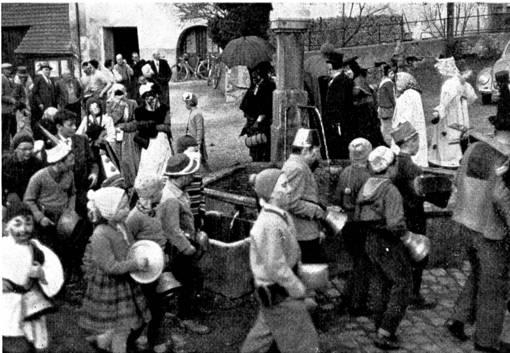
Abb. 4. Um den Dorfbrunnen.