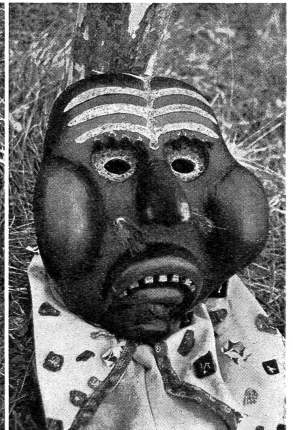
Abb. 7. Holzlarve von Zogg-Wohlwend.