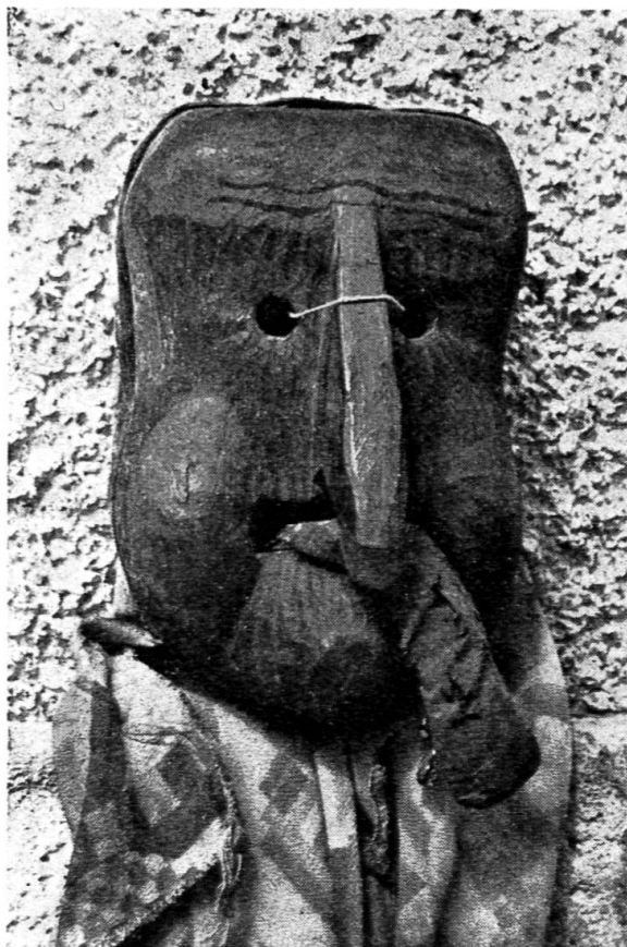
Abb. 5. Teufel.