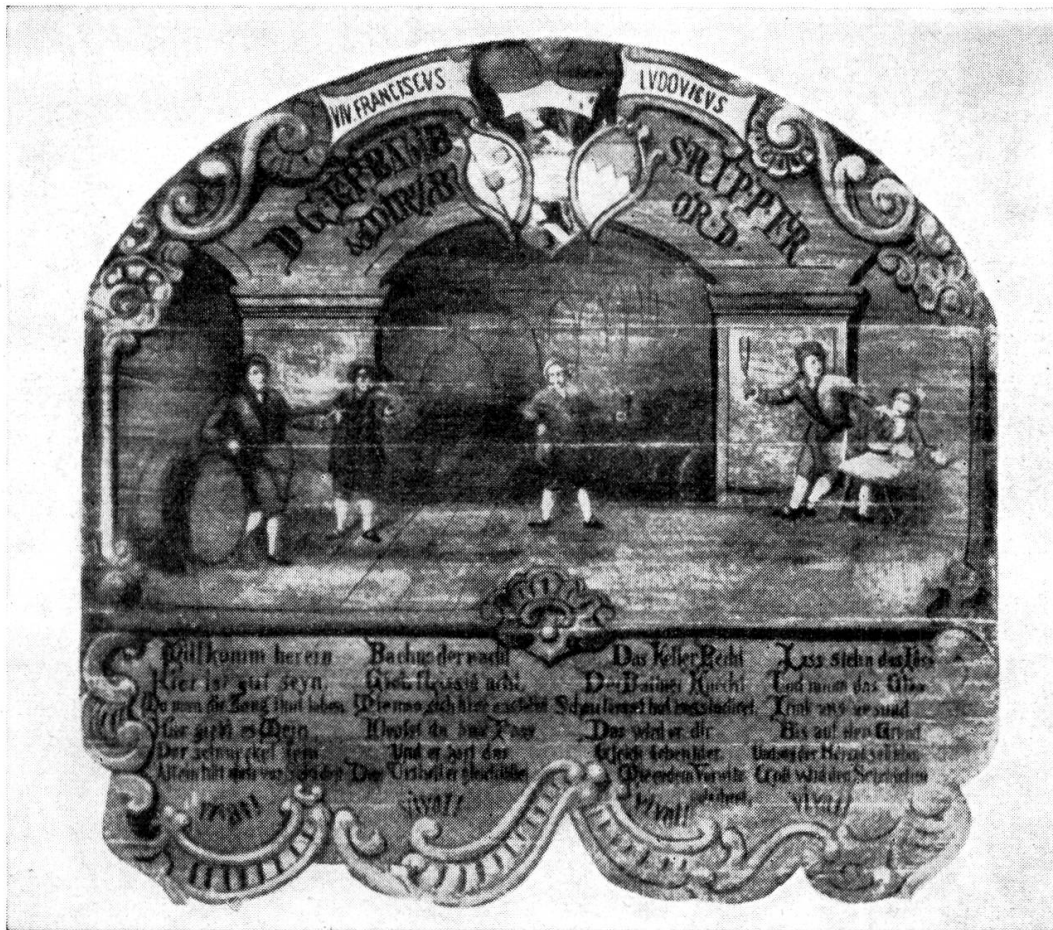
Abb. 1. Kellerrecht im fürstbischöflich bambergischen Hofkeller in Würzburg von ungefähr 1784.

Seltene Bildtafel in Form eines Fassbodens. Darstellung einer Kellerszene. Links: Eintritt der Gäste. Mitte: Willkommenspruch durch den Kellermeister. Rechts: Züchtigung.