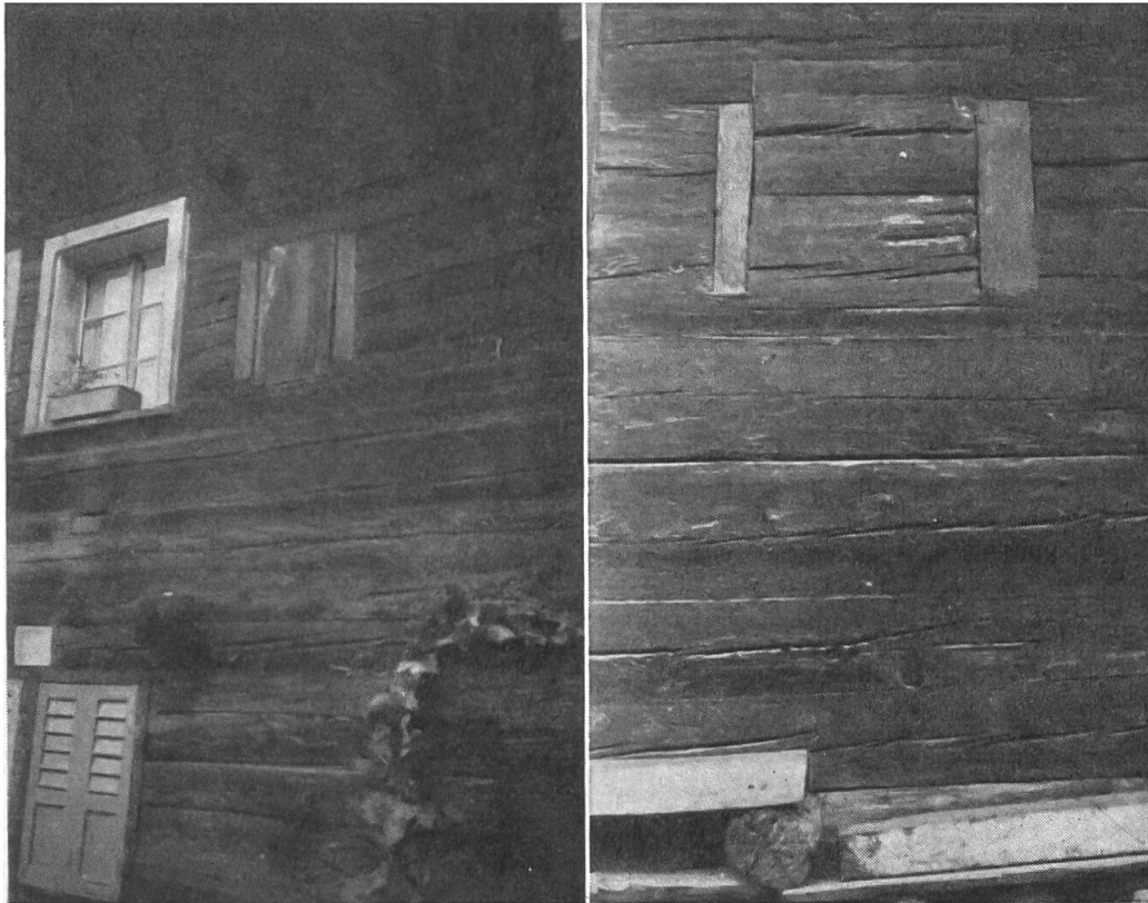
Abb. 3 (links). Visperterminen, Barmili, bewohntes Haus mit erneuerten Fenstern; «Seelenglotz» daneben, II. Stock, Scharnierbalken und Einfüllung deutlich abgezeichnet. Abb. 4 (rechts). Münster, bewohntes Haus im Unterdorf mit Jahrzahl 1609. «Seelenglotz» einzeln an Ostwand I. Stock, horizontal mit Wandbaumstücken eingefüllt; Scharnierbalken und Umrandung deutlich sichtbar.

Die Feststellungen in Turtmann waren für mich ein weiterer Hinweis auf die Herkunft dieses Brauchtums. Da es sich vermutlich um alemannisches Erbgut handelte, untersuchte ich in erster Linie das Goms und dann die Ortschaften landabwärts bis in die Gegend von Sitten. Systematische Nachforschungen oder auch nur Stichproben ergaben im Sommer 1953 bedeutende Resultate.