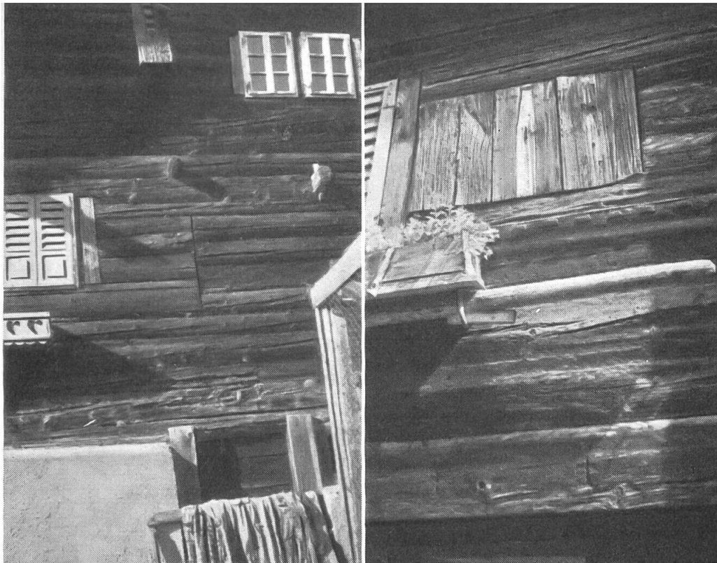
Abb. 7 (links). Münster, bewohntes Haus im Oberdorf. «Seelenglotz» rechts neben Fenster I. Stock, durch Wandbaumstücke eingefüllt; Abgrenzung nach rechts undeutlich, weil Scharnierbalken fehlt.