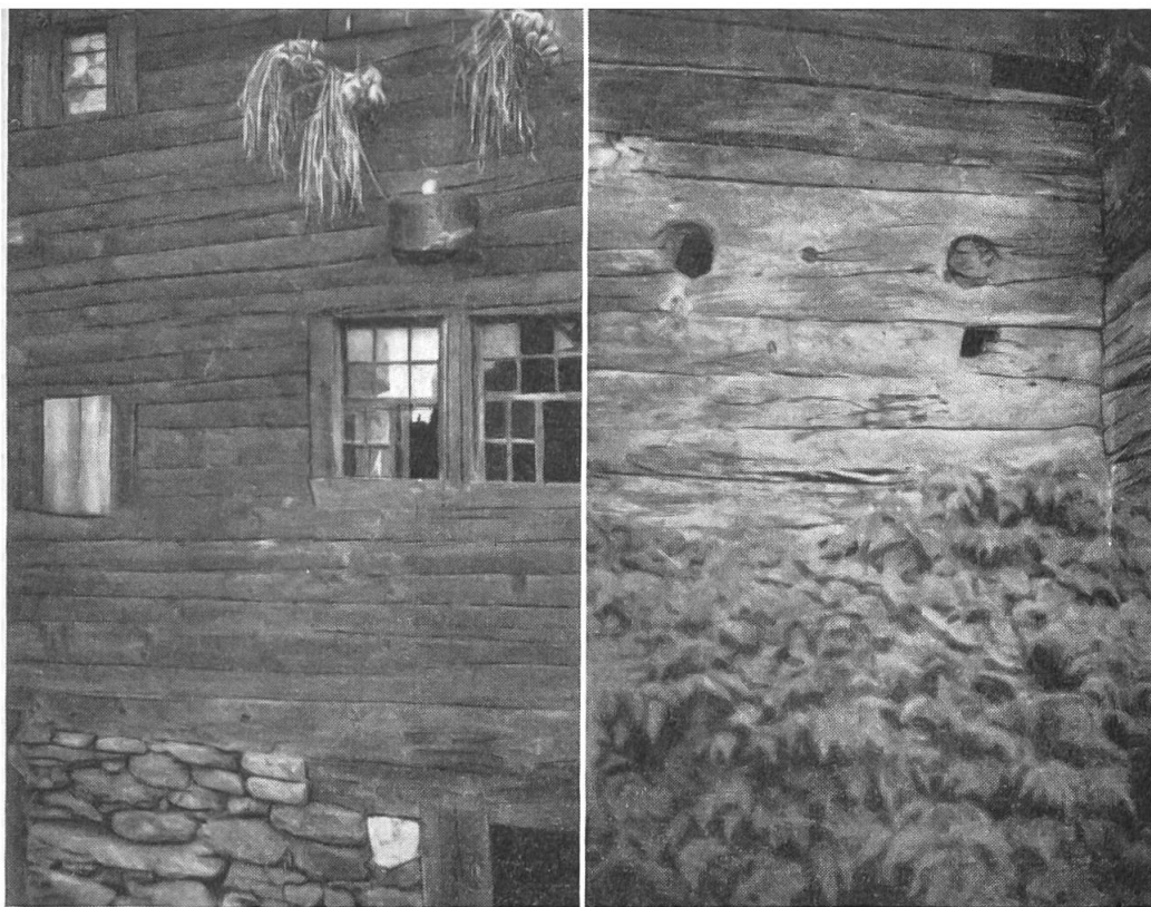
Abb. 11 (links). Stalddenried, Kleeboden. Seelenfenster verbalkt durch helles Brett. Abb. 12 (rechts). Zum Vergleich: Fuchs-Passlöcher, an einem Stall, ziemlich weit unten; mit Hohlbohrern ausgestemmt.

Zweck und Bestimmung der Seelenbalken im Wallis können als gleich angegeben werden, wie sie für die Walser Siedlungen beschrieben wurden. Die ähnlich konstruierte Anordnung berechtigt uns hiezu. Die meisten sind neben den gewöhnlichen Fenstern in die Strickwand eingebaut. Für diese wäre die Bezeichnung «Nebenfensterchen» nicht unzutreffend. Andere befinden sich an der Hauswand des Parterre-Stockes allein, von der Hofseite aus erreichbar. Die innere Anordnung (Bild 2, 4) über dem Bett scheint zu bekräftigen, dass ihre Funktion mit Totenbräuchen im Zusammenhange stand.