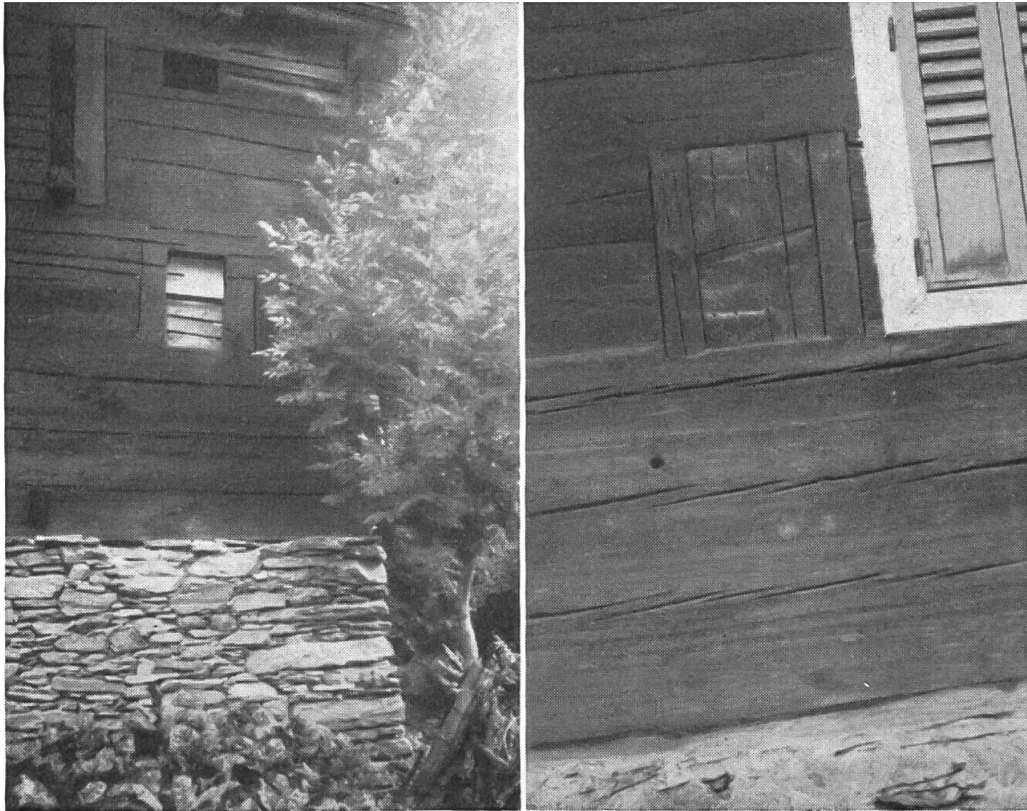
Abb. 5 (links). Embd, «Peter Josy-Hüs im Derfji», ohne Jahrzahl, unbewohnt. «Seelenglotz» an Südostwand allein I. Stock, durch helle Bretterfüllung deutlich gegen Scharnierbalken abgegrenzt.