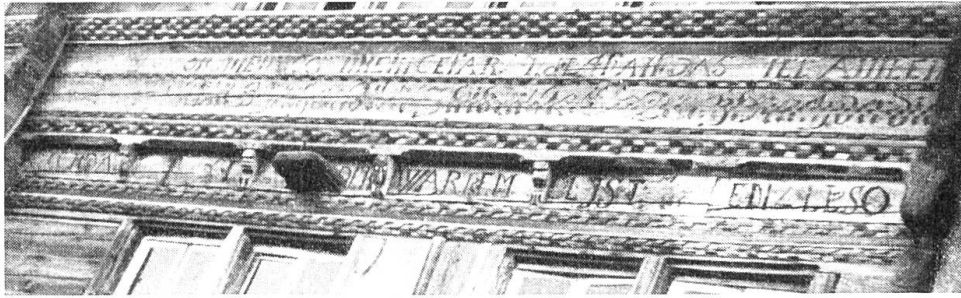
Schnitzerei an einem Haus in Bönigen.

Erforschung des Schweizerischen Bauernhauses interessierten Verbände und Institutionen angehören: