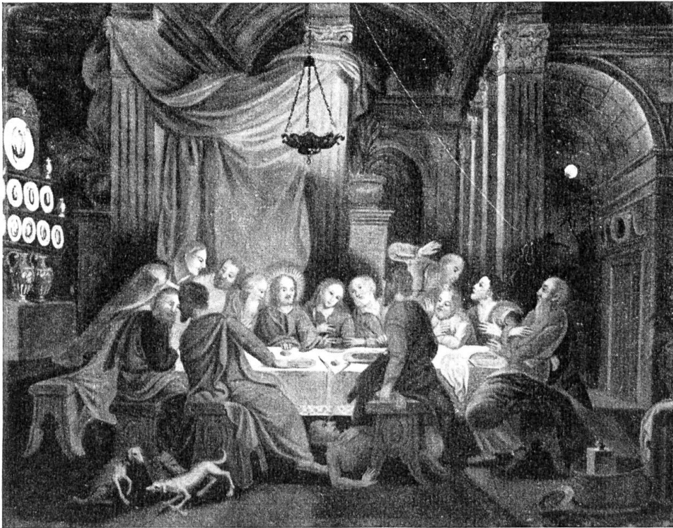
Abendmahl. Hinterglasmalerei. Solothurn, Museum der Stadt Solothurn.

Glanz fehlt, weil nur trockene Farben verwendet und hart nebeneinander gesetzt sind. Das Vorbild für Rahmen und Gemälde entspricht einer vergangenen Zeit. Wie eine Kindheits-erinnerung die Vorstellung von etwas Ausserordentlichem durch ein Leben hindurch prägen kann, mag einem Maler, der fernab vom Kulturstrom der eigenen Gegenwart stand, ein Gegenstand der Vergangenheit Ideal und Vorbild geblieben sein. Im Darstellerischen, das ihm Mühe bereitet, sobald es durchdachte räumliche Vorstellung oder abgestufte seelische Regungen verlangt, beschränkt er sich auf Gebärden. An Stelle einer individuellen Gestalt tritt der Typus, und zeichnerische Schwierigkeiten werden möglichst umgangen. Der Wille, alle die dem inhaltlichen Verständnis oder der kirchlichen Repräsentation dienenden Dinge beizubehalten, erhebt diese etwas vereinsamten Zeugen zu einer fast symbolhaften Erscheinung und verklärt die bescheidene Malerei mit einem Zug jugendlicher Frische, die entfernt an die frühchristliche Bildersprache erinnert. Wo ein Vorbild wegfiel, wie wahrscheinlich bei den fröhlichen Kerzenträgern, kommt der Volkston erfrischend zum Ausdruck.