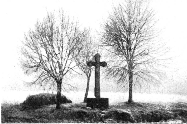
Bergkreuz auf der Fluh Wegenstetten.

Wegenstetten gestiftet zum 1900 sten Todestag Christi. Auf 1. August 1933 wurde das Kreuz fertig erstellt und nachts beleuchtet, dass es weithin in der Gegend sichtbar war.