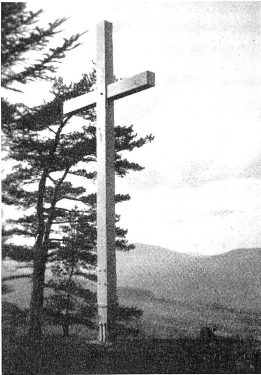
Kreuz auf Betberg.

kundeten. Auf Initiative von Sonnenwirt Walde aus Wittnau wurde 1868 das Kreuz durch ein anderes ersetzt und gleichzeitig eine aus Eisen konstruierte offene Bethalle errichtet. Das heute noch stehende einfache Kreuz mit Schutzdach stammt aus dem Jahre 1906.