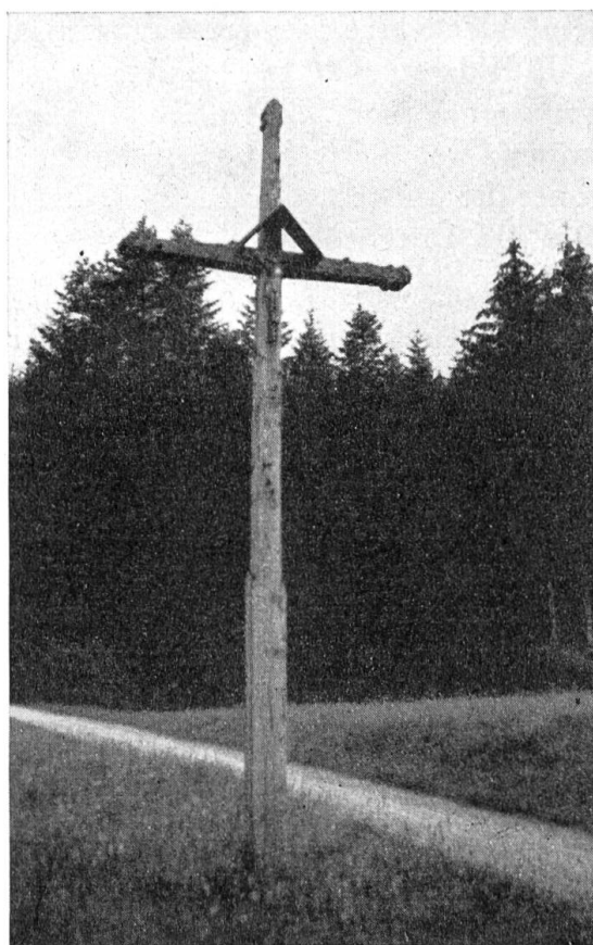
Kreuz auf dem Neuling bei Hellikon.