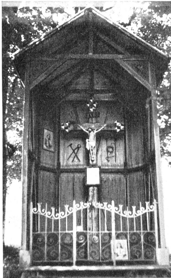
Kreuz auf dem Buschberg.