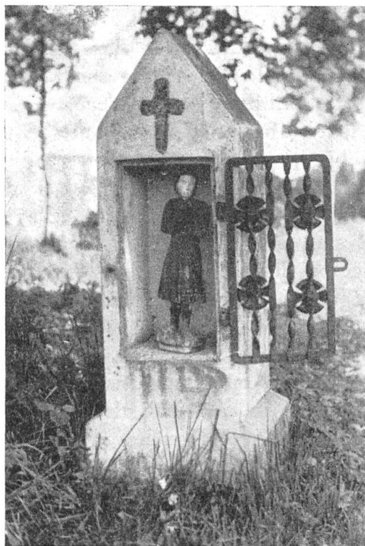
Abb. 1. Helgenstöcklein auf dem Wellberg in Willisau.