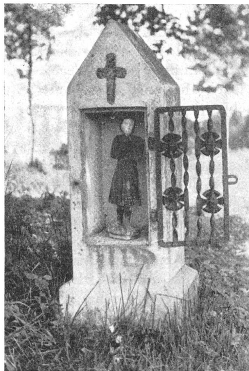
Abb. 1. Helgenstöcklein auf dem Wellberg in Willisau.

Franz Sidler: Zur Motiv- und Wallfahrtsaktion. — K. Oppenheim: Hochzeit in Carona. — H. Huber-Rupli: Ueber Beinamen in Hallau — M. S.: Hahnenbalken. — Bücheranzeigen. — Jahresversammlung. — Liederheft «Canzuns della Consolaziun».