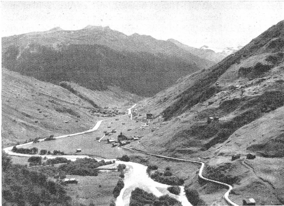
Abb. 3. Valsertal, links Aufstieg zum Berg.

Ihre Ausrüstung bestand aus einem wollenen Gewand aus dem selbstgewobenen starken „Landtuach“. Feste, gehörig genagelte Bergschuhe waren unerlässlich. Die Beine waren bis über die Knie herauf in selbstgemachte Gamaschen oder Stiefel aus Tuch eingebunden. Auf dem Kopf trugen sie eine Kappe, die man über die Ohren herunterlitzen konnte. Manchmal war es eine Pelzkappe. Die Hände steckten in gestrickten wollenen Handschuhen oder solchen aus Tuch, die innen mit Wolle ausgefüllt waren. Mantel kannten die Bergträger keinen. Ein sehr wichtiger Gegenstand ihrer Ausrüstung war die Schneebrille mit den grünen Gläsern, besonders im Frühjahr. Trotz ihres Gebrauches waren nicht selten entzündete Augen und Schneeblinde das Los der alten Bergträger.