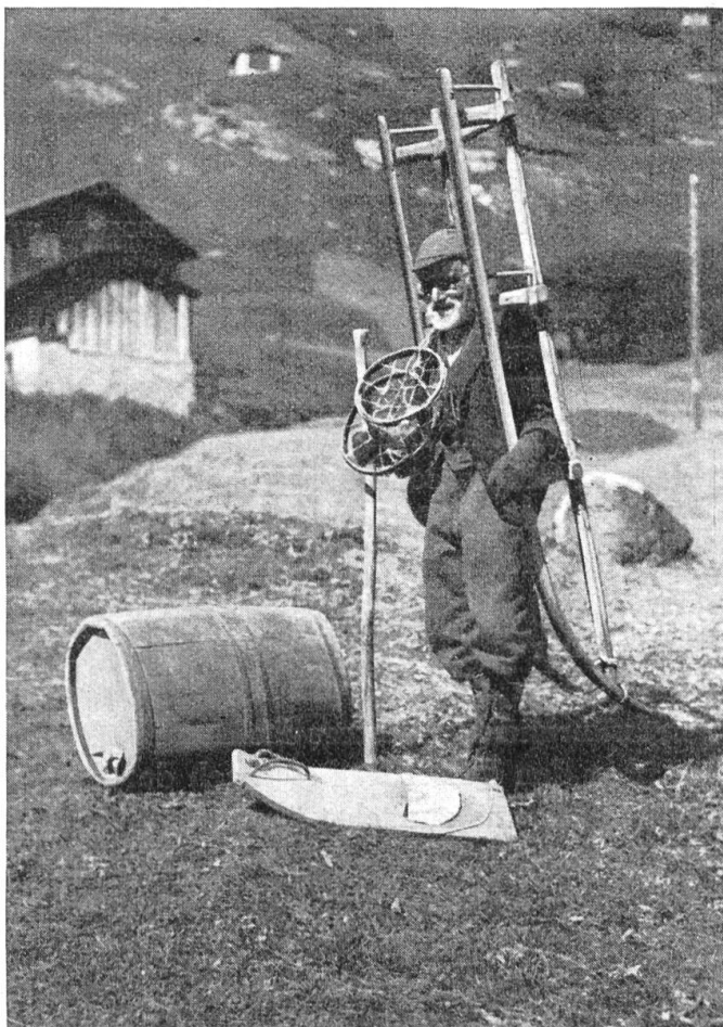
Abb. 1. Hählblattachlaas als Bergträger.