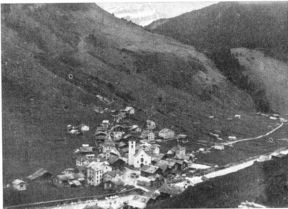
Abb. 2. Vals-Platz, rechts die Vleehalta.

es den steilen „Wallatschstutz“ hinauf zu den Hütten der Wallatschalp und von dort über den Alphügel zur „Arva“. Im Sommer wählt man von den Hütten aus den kürzeren Weg über den „Abadvatt“, eine steile Halde, die zur Schneezeit rutschgefährlich ist. Dann gelangt man am „grossa Hirt“ vorbei zur „Chella“, zum „Chellaboda“, und zuletzt geht es durch die Geröllhalden des Valserhorns in den Sattel hinauf, der 2500 m hoch liegt. Der zu überwindende Höhenunterschied zwischen Dorf und Passhöhe beträgt rund 1250 m. Man erreicht die Höhe in 4—5 Stunden. Der Aufstieg von Hinterrhein ist gleichmässig steil und viel kürzer und erfordert 2 Stunden. Der Valserberg ist gut begehbar und bei sicherem Wetter eine schöne, lohnende Wanderung. Bei anderem Wetter aber kann sie ungemütlich werden. Im Handumdrehen hat der Föhn, dieser unvertraute Geselle, ein Getümm von schwarzen Wolken über den Bernhardin heraufgestossen, und man steckt unversehens in Nebel und Unwetter.