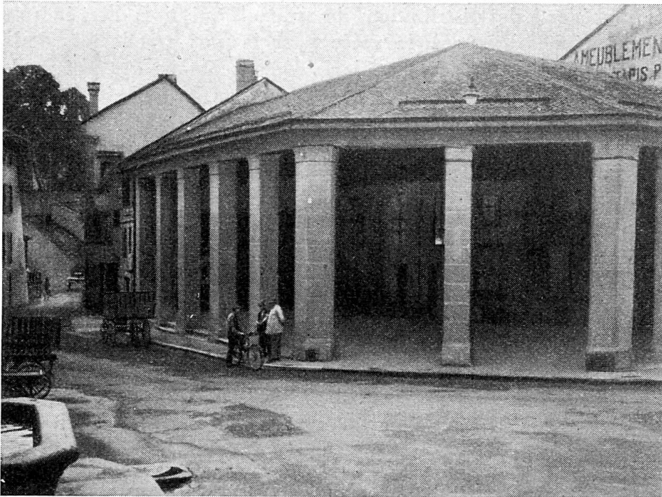
Fig. 2. Moudon: La Grenette.

pour arriver à une date toujours plus proche de la fin du mois, à la foire de Noël ou foire aux domestiques, le 27 décembre. Sur la Place du Pont ou devant l'Hôtel-de-ville, de nombreux valets de ferme et servantes, celles-ci portant le châle de laine noire et un petit panier indiquant qu'elles cherchaient une place, attendaient d'être engagés. Le soir, ils gagnaient le nouveau domicile sur des chars-à-bancs transportant leur malle, simple caisse de bois généralement vernie en vert. Ce jour-là les écoles avaient congé; la circulation était intense et le brouhaha montant de la cohue était tel qu'à midi il fallait sonner la grosse cloche.