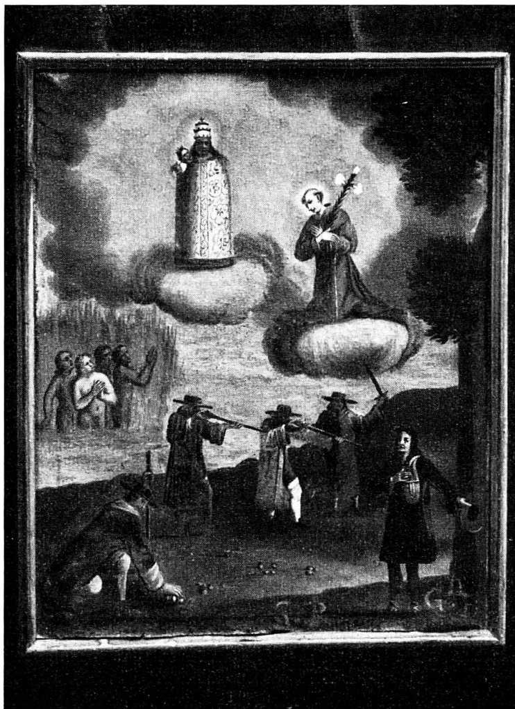
Chiesa di St. Antonio a Cologna: Ex-voto di G. D. B.

Non mai come in questi ultimi anni si è dato importanza, anche da studiosi e da artisti di gran nome, a tutto quello che in qualsiasi modo è manifestazione artistica della vita del popolo. Così il vasto patrimonio folkloristico di ogni regione è divenuto oggetto di amoroze ricerche e ne è sorta una copiosissima produzione letteraria che è un miscuglio di storia, di filologia e di critica d'arte: leggende, costumi, tradizioni, proverbi, iscrizioni, canti, balletti antichi, figure di ex voto, tutto diventa interessante per chi ama la semplice vita del popolo e sa trovare dell'arte anche nelle più umili manifestazioni del pensiero popolare. Le grandi e perfette opere d'arte non vanno certo ricercate fra le nostre valli di montagna, benchè di qualche splendida archi-