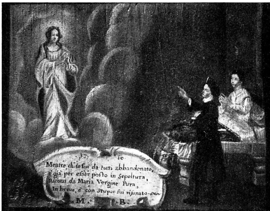
Chiesa di S. Maria: Ex-voto di M. B. (podestà B. Massella).

è anche il più commovente e il più straordinario per la spontanea perfezione che si nota nella disposizione delle figure: il pittore ha potuto dar prova della sua capacità creativa, componendo un quadro quasi senza orizzonte e sapientissimo nella disposizione delle figure: ecco da una parte il fanciullo che cade riverso da un albero sopra una roccia; in primo piano il padre che prega in ginocchio il Santo di Padova, a sua volta inginocchiato davanti alla Madonna che stende le braccia. È un quadretto che fa impressione all'occhio del critico, perchè si può dire che è composto veramente a regola d'arte, cioè su le verticali, le diagonali e le orizzontali: un gran maestro non avrebbe saputo comporlo in modo più perfetto.