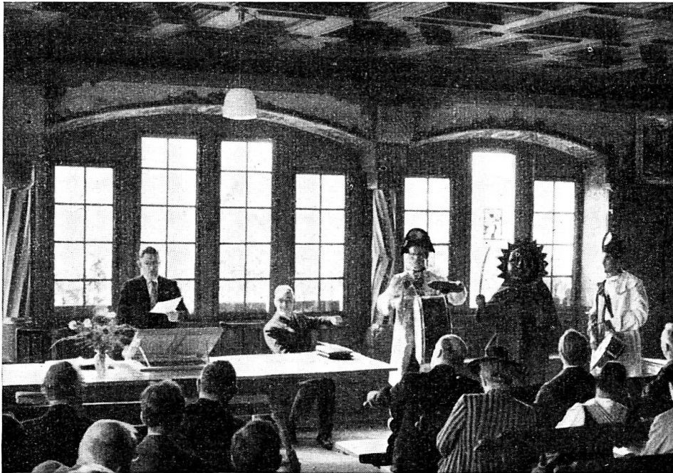
Jahresversammlung in Sursee: Der Gansabhauer mit Pauker und Trommler.