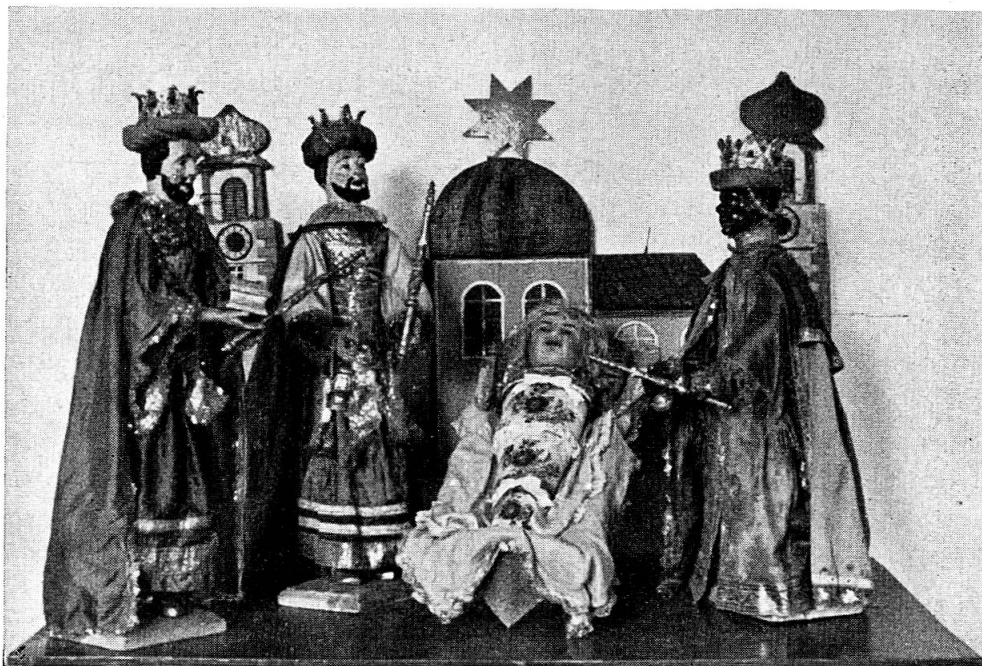
Die drei Könige.

Zwei Tage nach Weihnachten gehen die Hirten wieder von der Krippe weg zu ihren Schafen, die sich nun in drei Gruppen um ihren Hirten scharen. Auf den Neujahrstag hin kommt der Hohepriester vor die Krippe, um die Beschneidung des Herrn vorzunehmen. Das Christkind wird vor ihn gerückt. Am Abend des Neujahrstages taucht am Rande der Szenerie der erste der drei Könige, Kaspar, der Mohr, auf einem Kamel reitend auf (leider wurden die Kamele verbrannt!). Am 2. Januar erscheint von der andern Seite her Melchior, ebenfalls hoch zu Kamel und am 3. Januar wird auch Balthasar sichtbar. Sie rücken nun mit jedem Tage der Krippe etwas näher. An einem Faden hängt vor ihnen der Stern, der der Krippe ebenfalls immer näher gerückt wird. Am 6. Januar endlich stehen alle Könige anbetend vor der Krippe, einer der Hirten muss ihre Kamele bewachen. Mit dem