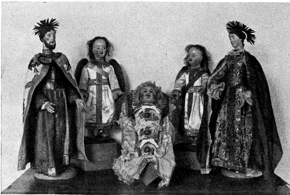
Maria und Josef.

Die Spieler waren 65—70 cm hohe Figuren. Während die Köpfe und die Extremitäten geschnitzt sind, besteht der Corpus aus Holzstücken, die durch Drähte miteinander verbunden sind,