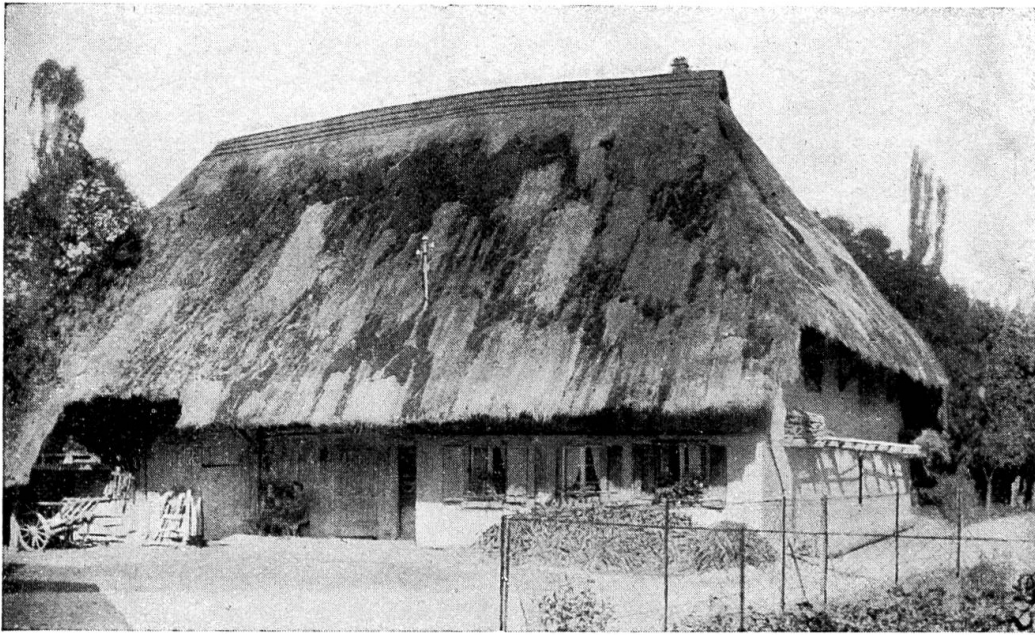
Figur 2b. Strohdachhaus in Möhlin.