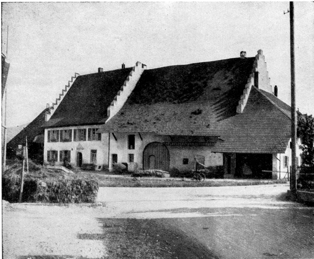
Figur 3. Altes Steinhaus mit Treppengiebel.