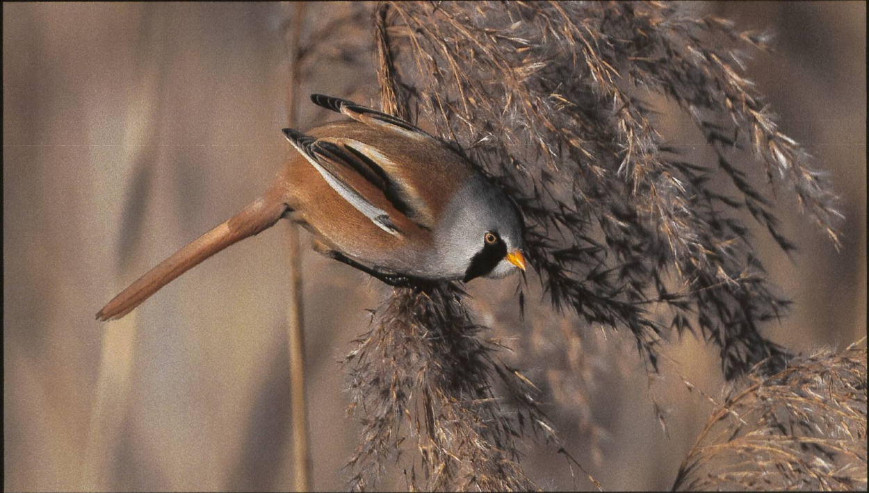
Bartmeise Panurus biarmicus .

Der Bodensee und seine angrenzenden Gebiete sind für alle Ornithologen und Fotografen ein beliebtes Beobachtungsgebiet. Besonders im Winter und zu den Zugzeiten ist sowohl die Anzahl, als auch die Vielfalt der Vögel grossartig. Einzig Nebel, Kälte und Bise machen das Fotografieren manchmal schwierig. Ein grossartiges Gebiet, dem es Sorge zu tragen gilt.