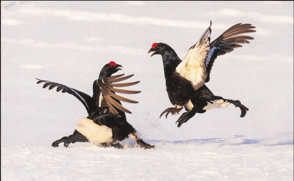
Tafel 18 und 19 Birkhuhn Lyrurus tetrrix