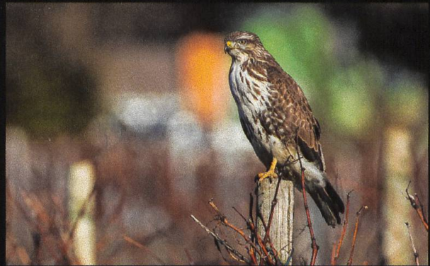
Mäusebussard Buteo buteo .