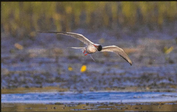
Flusseeschwalbe Sterna hirundo .