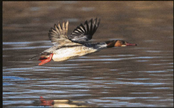
Gänsesäger Mergus merganser , Weibchen.