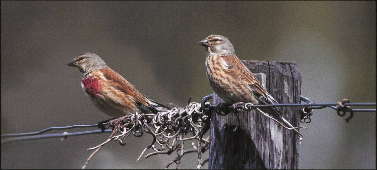
Bluthänfling Linaria cannabina .

In den letzten Jahren wurden viele Rebberge ökologisch aufgewertet. Diese Massnahmen und ein reduzierter Herbizideinsatz tragen dazu bei, dass sich spezielle Vogelarten wieder vermehrt in den Rebhängen zeigen. Bei vielen Naturfotografen ist es verpönt, Tiere in einer von Menschen gestalteten Landschaft zu fotografieren, es muss Natur pur sein. Ich selber bin aber der Ansicht, dass man Vögel auch in dieser Umgebung zeigen darf, zumal die Artenvielfalt wieder zugenommen hat und die Anstrengungen der Winzer und der Naturschutzverbände so dokumentiert werden können.