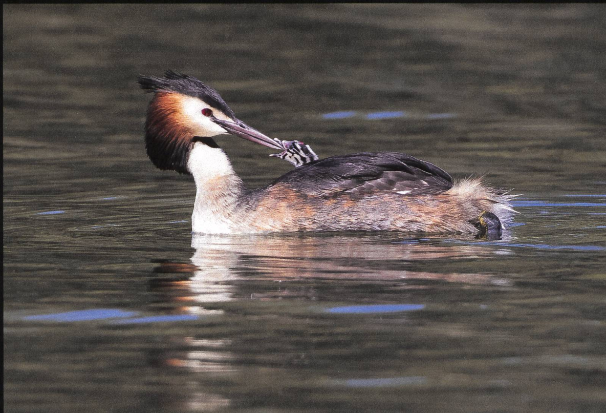
Haubentaucher Podiceps cristatus .