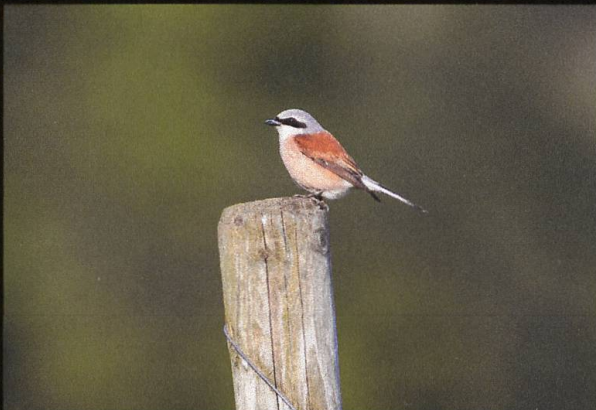
Neuntöter Lanius collurio .