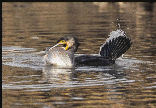
Kormoran Phalacrocorax carbo .