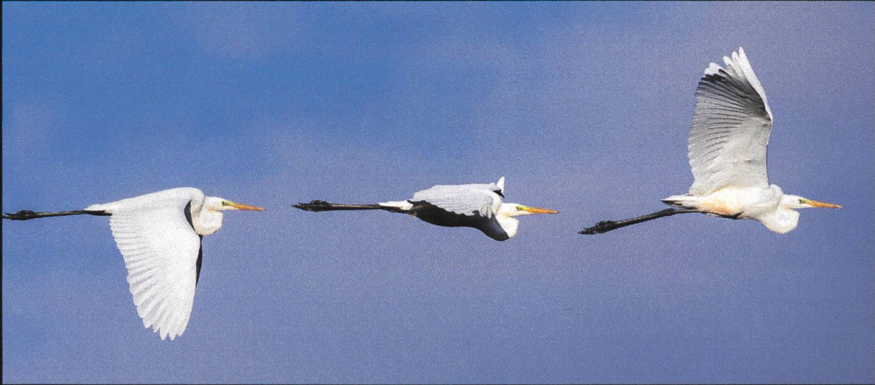
Silberreiher Ardea alba .

Bis vor wenigen Jahren war die Sichtung eines Silberreiher bei uns eine kleine Sensation. Heute halten sich im Winter immer mehr dieser Vögel bei uns auf. Vielfach trifft man sie auch im Verband mit unseren einheimischen Graureihern an. Im Winter ist der Schnabel des Silberreiher gelb ausgefärbt, was ihn zusammen mit seinen markanten Augen in den monochromen Schneelandschaften besonders reizvoll zum Fotografieren macht. In der Balzzeit färbt sich der Schnabel auf dunkel bis fast schwarz um.