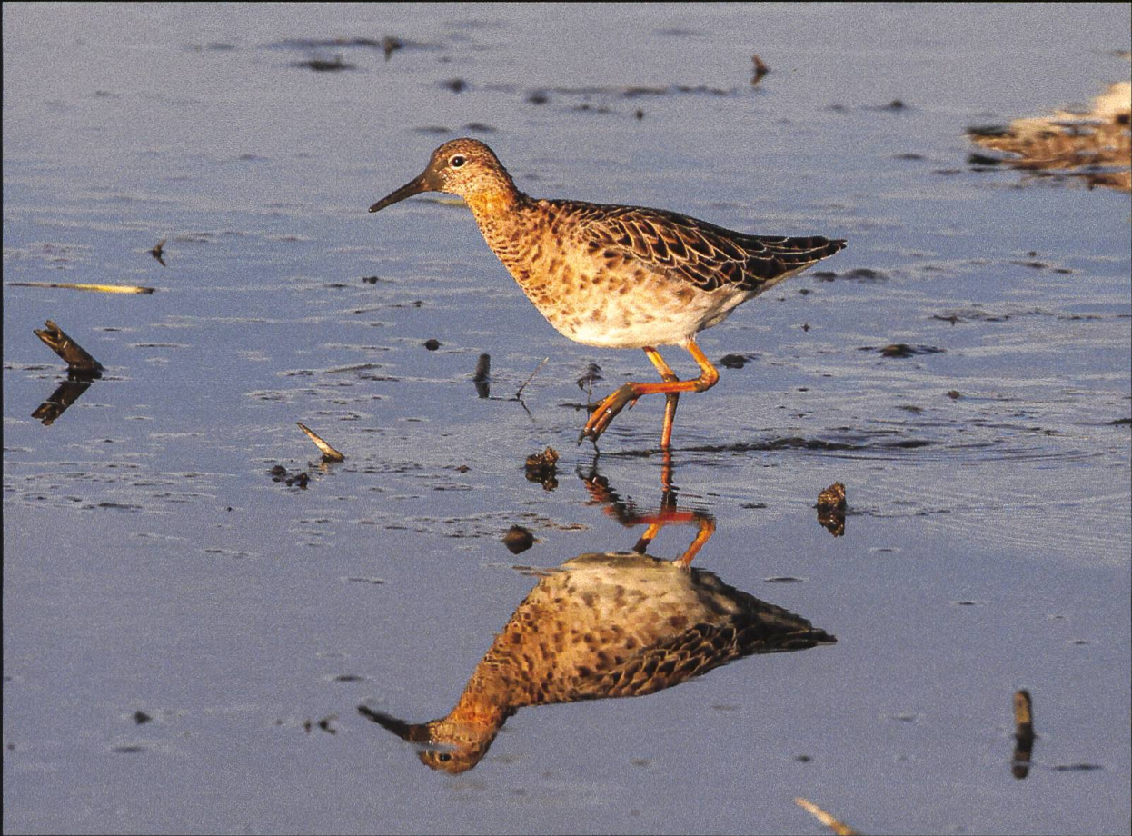
Kampfläufer Calidris pugnax .