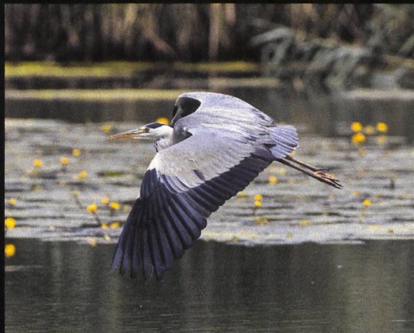
Graureiher Ardea cinerea .