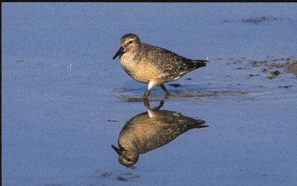
Knutt Calidris canutus .