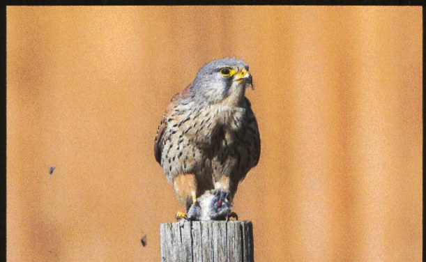
Turmfalke Falco tinnunculus .

Der Turmfalke ist bei uns die weitaus häufigste Falkenart, die man gut bei der Mäusejagd in ihrem Rüttelflug beobachten kann. Beim Fotografieren wird es meist etwas schwieriger, weil der Turmfalke meist mit der Sonne im Rücken jagt und so sein Antlitz immer im Schatten liegt. .