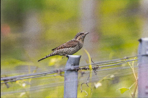
Wendehals Inys torquilla .