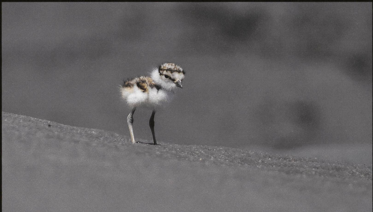
Flussregenpfeifer Charadrius dubius .

Diesen zierlichen Vogel beobachte ich gerne im Frühjahr, wenn er aus dem Süden zurückkehrt. Kleiner als eine Amsel sucht er sofort nach seiner Rückkehr nach einer geeigneten Kiesbank für sein Nest, die möglichst auch einem Hochwasser standhält. Meistens brütet er zweimal pro Saison, aber der Bruterfolg hält sich bei uns in Grenzen. Menschen und deren Vierbeiner sind durch ihr Freizeitverhalten am Wasser leider die grössten Verursacher für Störungen der Vögel am Nest, meist in Unkenntnis.