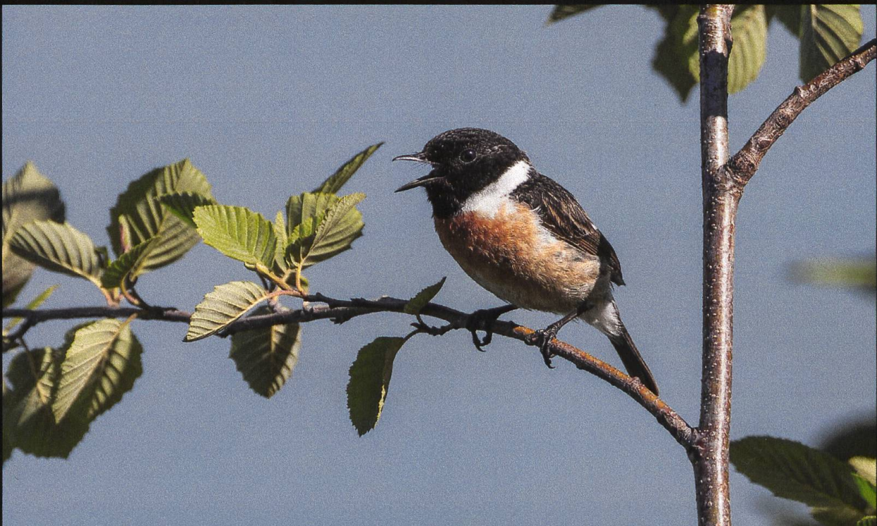
Schwarzkehlchen Saxicola torquatus .

Das Schwarzkehlchen ist mit dem Rotkehlchen verwandt, aber etwas kleiner. Meistens sieht man es zuoberst auf einem Zaunpfahl oder kleinem Strauch sitzen. Hier lauert es auf vorbeifliegende Insekten oder es markiert sein Revier. Das Männchen ist mit seinem schwarzen Kopfgefieder für den Namen verantwortlich. Im Frühling ist es immer wieder eindrucklich, diesem kleinen Vogel bei seinem Balzgesang zuzusehen und zuzuhören.