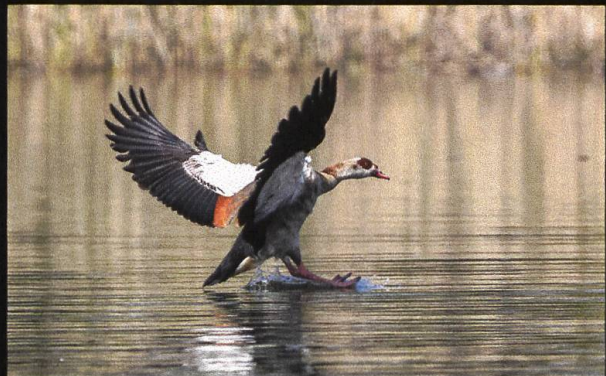
Nilgans Alopochen aegyptica .