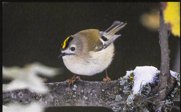
Wintergoldhähnchen Regulus regulus .

Die Wasseramsel ist bei uns der einzige Singvogel, der auch schwimmen und tauchen kann. Besonders im Winter, wenn das Wasser klar ist, kann man den Tauchgang der Wasseramsel gut mitverfolgen. Dabei werden die Flügel unter Wasser als Ruder eingesetzt. Mit ihren langen Krallen findet sie zudem auch einen guten Halt auf glitschigen Steinen.