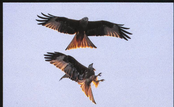
Rotmilan Milvus milvus .

Der Rotmilan ist einer der schönsten und elegantesten Greifvögel für mich. Heute ist er bei uns wieder recht häufig anzutreffen, das war aber nicht immer so. Nachdem in der Schweiz nur noch minimale Bestände vorhanden waren, wurde er 1925 unter Schutz gestellt, erholte sich aber in den nächsten 50 Jahren nur sehr langsam. Heute überwintern im Rheintal wegen der milder werdenden Winter immer mehr Rotmilane.