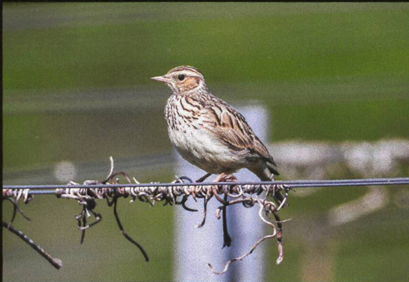
Heidelerche Lullula arborea .