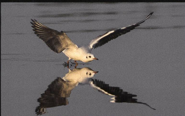
Lachmöve Larus ridibundus .