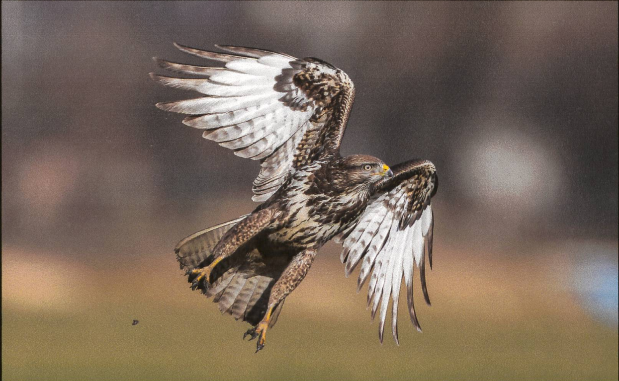
Mäusebussard Buteo buteo .