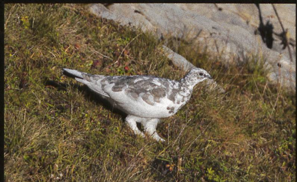
Alpenschneehuhn Lagopus muta .

Was ich persönlich an diesem Vogel so spannend finde, ist der Wechsel seines Federkleides, das sich perfekt den verschiedenen Jahreszeiten anpasst. Zudem hat er mit seinen befiederten Füßen und Nasenöffnung keine Probleme mit der Kälte. Auch im Frühsommer, wenn es dem Fotografen auf seinen Bergtouren den Schweiß auf die Stirn treibt, hält sich dieser Vogel gerne in den letzten verbleibenden Schneefeldern auf.