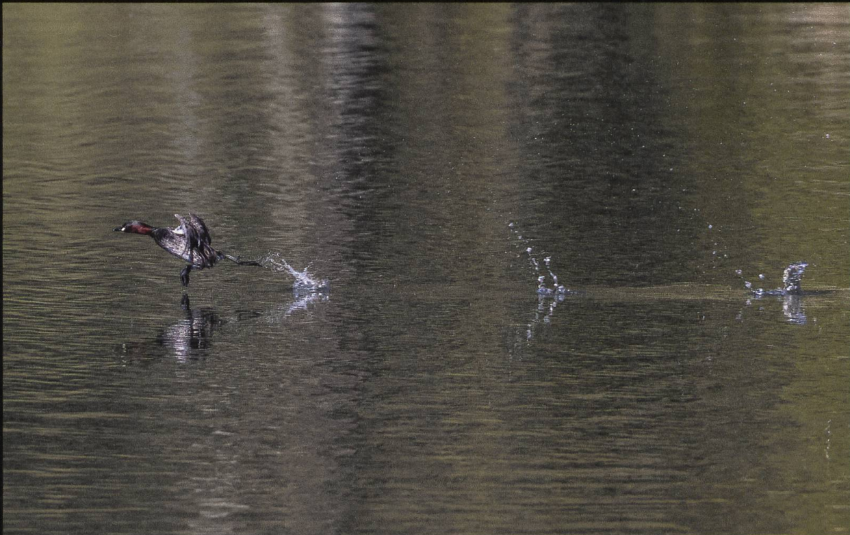
Zwergtaucher Tachybaptus ruficollis .

Während der Balz- und Brutzeit kann dieser kleine Vogel sehr laut und aggressiv werden, wenn es gilt, einen Eindringling aus seinem Revier zu vertreiben. Sein bevorzugtes Habitat ist das Wasser, in dem er die meiste Zeit verbringt. Fliegen kann er zwar, aber für den Start aus dem Wasser braucht er einen langen Anlauf und es sieht sehr witzig aus, wie er über das Wasser sprintet, um irgendwann doch noch abzuheben.