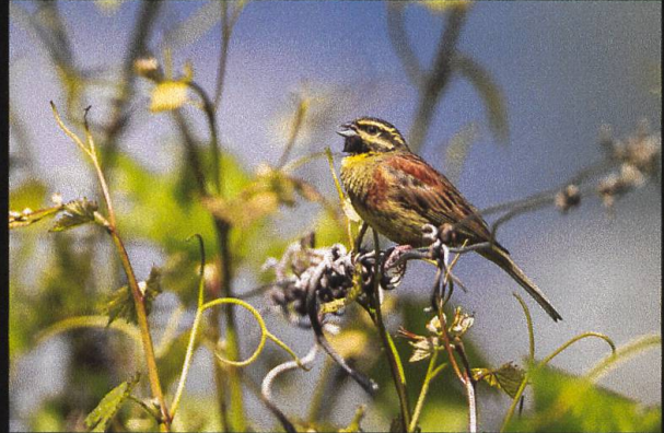
Zaunammer Emberiza cirius .