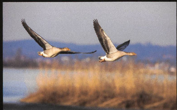
Graugänse Anser anser .