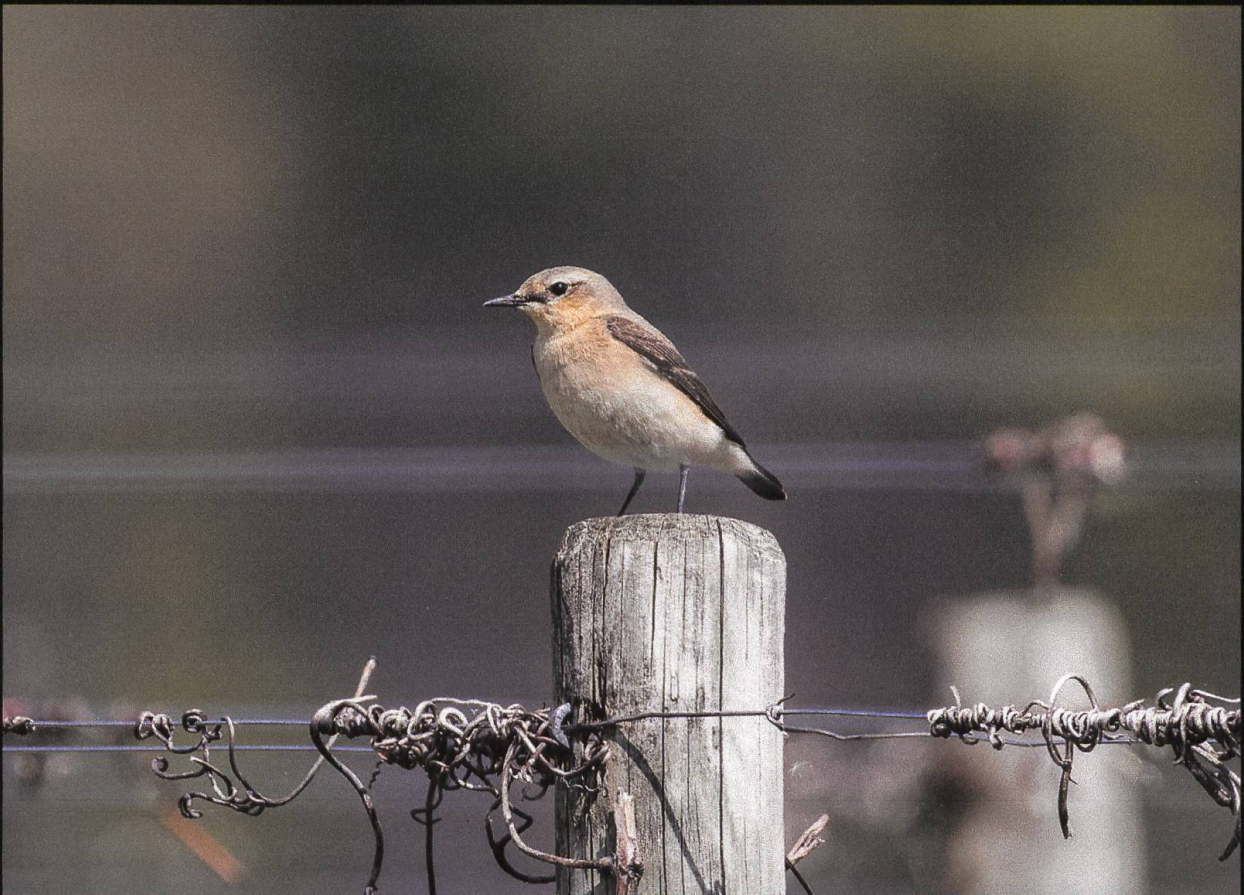
Steinschmätzer Oenanthe oenanthe .