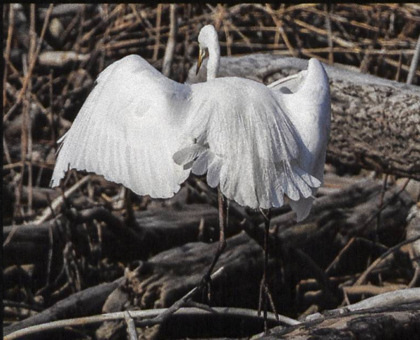
Silberreiher Ardea alba .