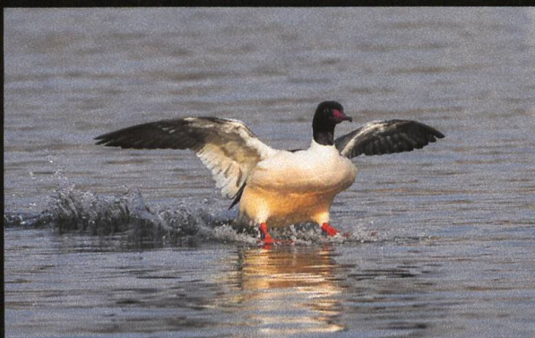
Gänsesäger Mergus merganser , Männchen.