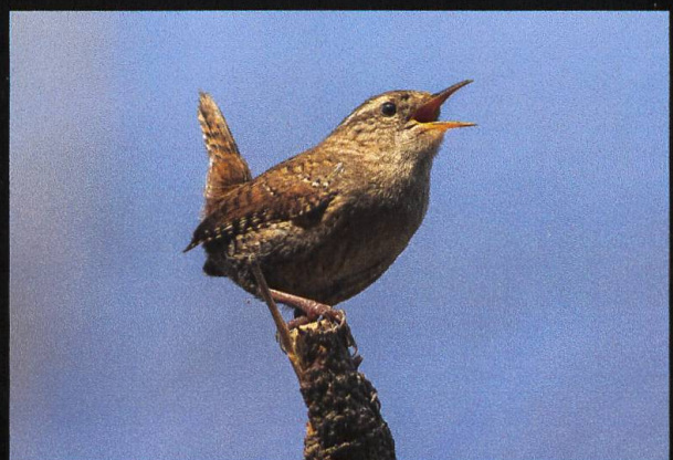
Zaunkönig Troglodytes troglodytes .

Mit einem Gewicht von 4 – 7 Gramm ist das Wintergoldhähnchen zusammen mit dem Sommergoldhähnchen der kleinste Vogel in der Schweiz, ja sogar in Europa. Er ist ständig auf der Suche nach Futter, muss er doch ungefähr die Hälfte seines Körpergewichts täglich fressen.