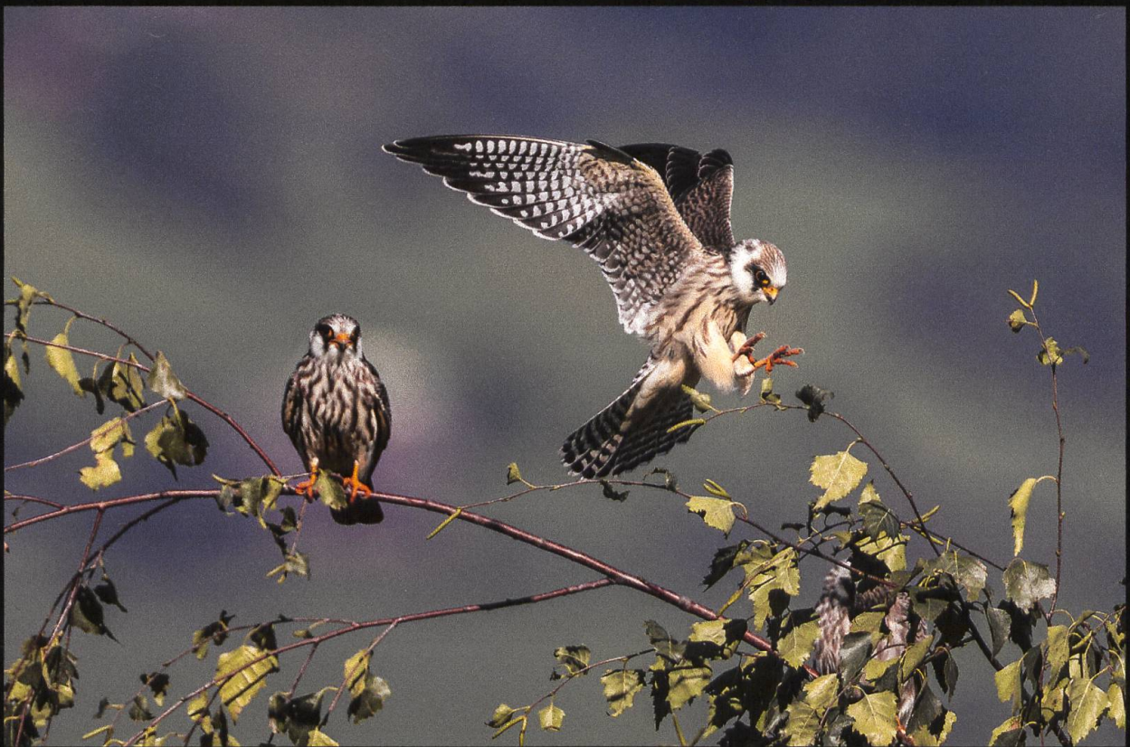
Rotfussfalke Falco vespertinus .

Manchmal hat man als Fotograf das Glück, im Herbst auf einen Trupp Rotfussfalken, die auf dem Zug nach Süden sind, zu treffen. Dieser gesellige Vogel bleibt, wenn das Futterangebot stimmt, für ein oder mehrere Tage an einem Standort, verschwindet aber ebenso schnell wie er gekommen ist.