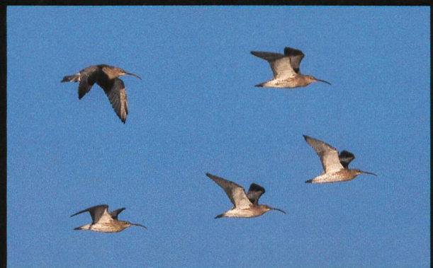
Grosser Brachvogel Numenius arquata .

Mit einer Flügelspannweite von fast einem Meter und seinem langen Schnabel ist der Grosse Brachvogel eine imposante Erscheinung. Da er sehr gesellig ist, trifft man ihn in der Bodenseeregion auch mal in grösseren Trupps an, die durchaus hundert und mehr Individuen umfassen können. Trotz der grossen Anzahl an Vögeln ist der Bruterfolg in der Schweiz und dem angrenzenden Vorarlberg sehr gering, was wahrscheinlich auf zu wenig geeignete Brutplätze zurückzuführen ist. Verblüffend ist auch, dass dieser Vogel bis zu 30 Jahre alt werden kann.