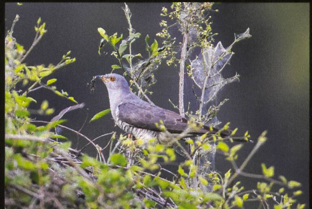
Kuckuck Cuculus canorus .