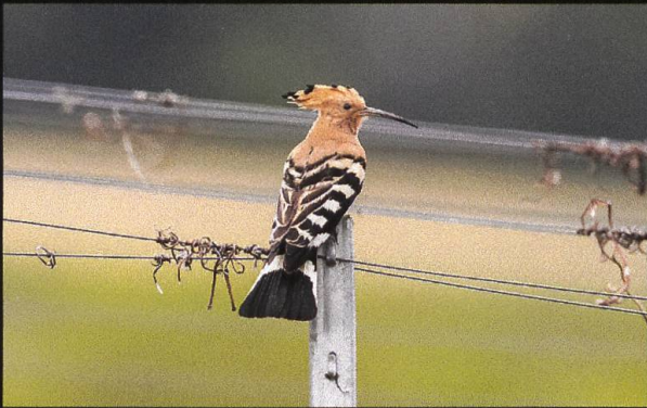
Wiedehopf Upupa epops .