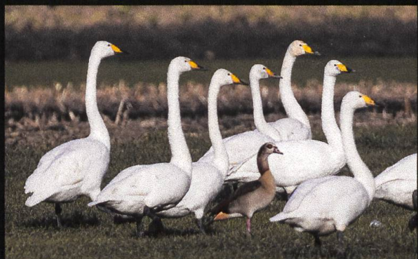
Singschwäne Cygnus cygnus .