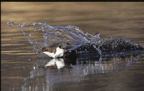
Wasseramsel Cinclus cinclus .

Die Wasseramsel ist bei uns der einzige Singvogel, der auch schwimmen und tauchen kann. Besonders im Winter, wenn das Wasser klar ist, kann man den Tauchgang der Wasseramsel gut mitverfolgen. Dabei werden die Flügel unter Wasser als Ruder eingesetzt. Mit ihren langen Krallen findet sie zudem auch einen guten Halt auf glitschigen Steinen.