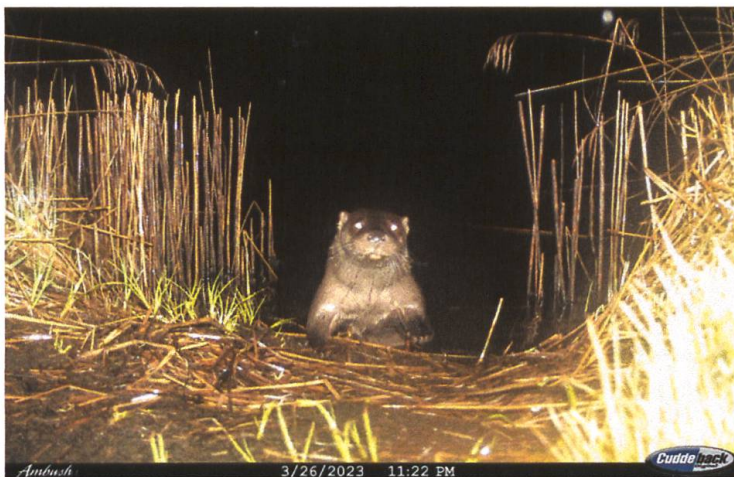
Abbildung 2: Fischotter am Teich (Nachtaufnahme).

häute zwischen den Zehen ist er perfekt an seine semiaquatische Lebensweise angepasst (StMELF 2024).