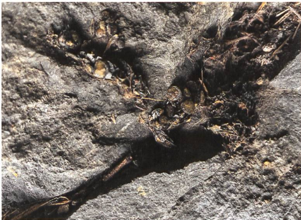
Abbildung 3: Fischotterkot in zersetztem Zustand.

Fischotterlosung kann als amorphe, schwarze bis graue Haufen mit Schuppen und Gräten oder in fester, wurstförmiger, an einem Ende stumpf und zum anderen Ende spitz zulaufender Form vorkommen. Unabhängig von der Ausgangsform zersetzt sich Fischotterlosung fortschreitend zu einem Haufen von Schuppen und Gräten. Wurden mehr Säugetiere und Haare verzehrt, ist die Losung fester und wurstförmiger. Gelegentlich ist die Losung mit der Ausscheidung des gelblichen, braunen oder grünen Analsekrets versehen (GROLMS 2021).