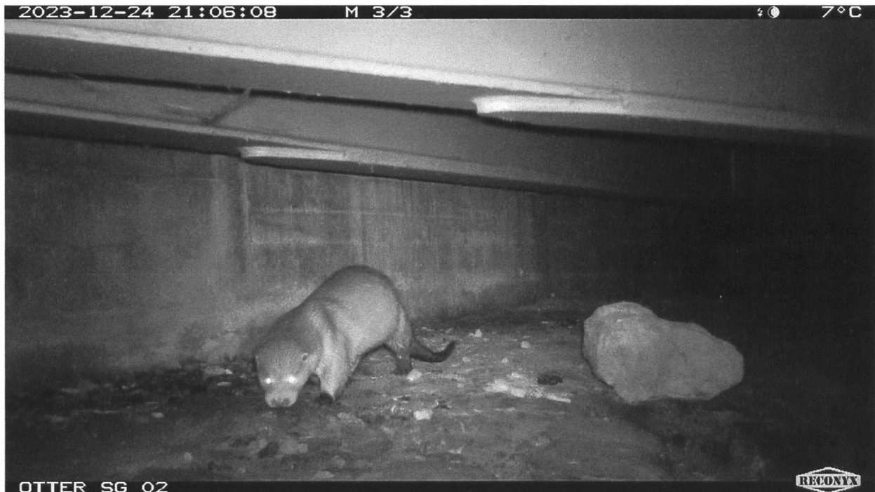
Abbildung 6: Fischotter unter Brücke (Nachtaufnahme).

berger- und Rheintaler-Binnenkanal machen. Die beiden Kanäle zählen zu den besten Äschen- und Forellengewässern in der Schweiz, weshalb diese für den Fischotter bestens geeignete Lebensräume sind. Durch Konservierung von frischem Kot kann mittels DNA-Auswertung der Gen-Stamm der Otter bestimmt werden. Einige dieser Proben wurden im Labor der Universität Lausanne (Laboratoire de Biologie de la Conservation) genetisch untersucht.