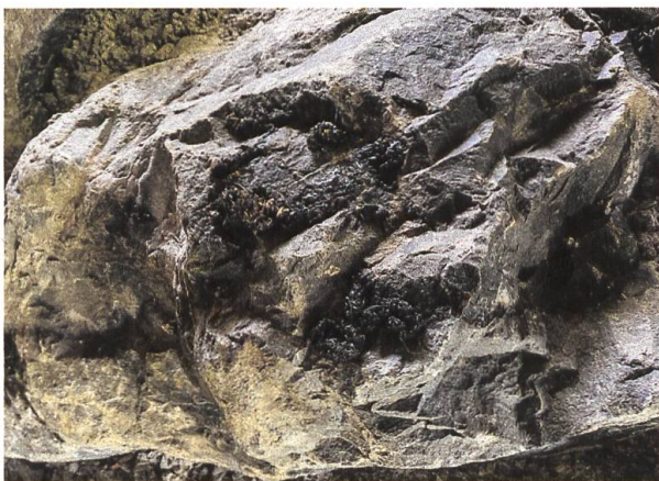
Abbildung 4: Fischotterkot in frischem Zustand.