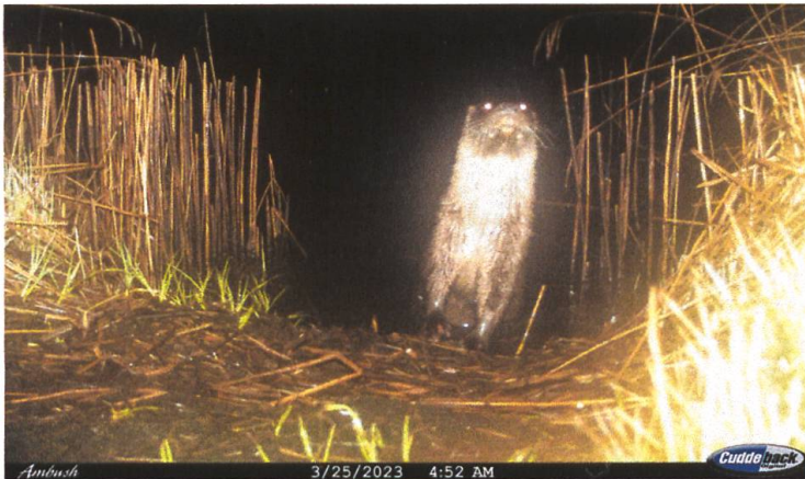
Abbildung 1: Fischotter am Teich (Nachtaufnahme).