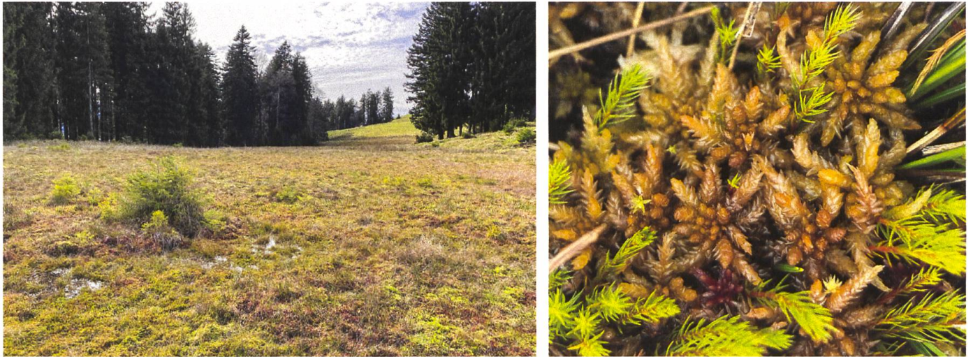
Abbildung 7: Fundort von Sphagnum affine in der Breitenau (links) und Polster gemischt mit anderen Moorarten.

Schutzmassnahmen: Das Moor in der Breitenau ist in die Schutzverordnung der Gemeinde Gommiswald aufgenommen worden. Die entsprechenden Moorschutzmassnahmen müssen beibehalten werden.