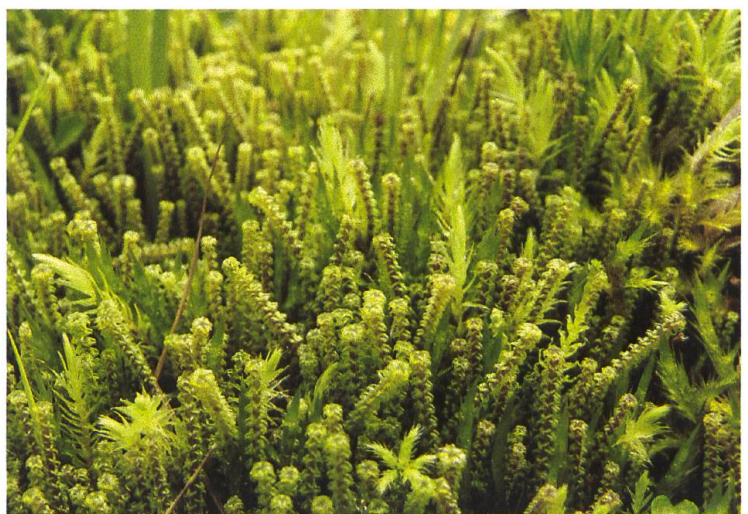
Abbildung 5: Paludella squarrosa mit zurückgekrümmten Blättern, gemischt mit anderen Flachmoorarten.

Das Zwerg-Filzmützenmoos ist eine Pionierart auf offenen, nährstoffarmen und etwas sauren Standorten wie lichten Wäldern oder mageren Weiden. Von der verwandten Art Polytrichum aloides ist sie fast nur unterscheidbar, wenn die