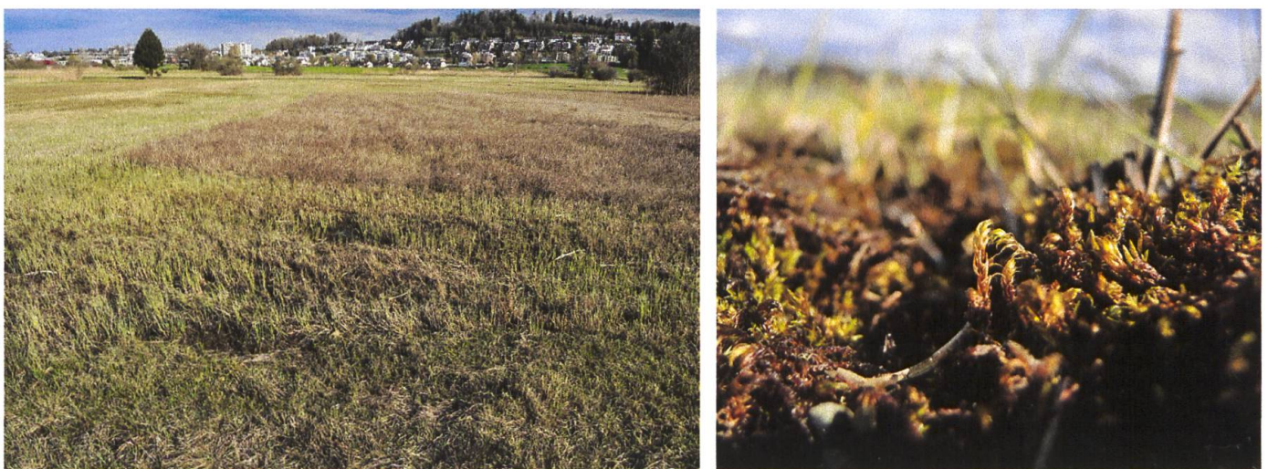
Abbildung 2: Feuchte Senke im Flachmoor Joner Allmeind (links) und Drepanocladus lycopodioides (rechts).

Schutzmassnahmen: Renaturierung von Mooren, Verbesserung des Wasserhaushaltes, kein Auffüllen von nassen Senken in Mooren.