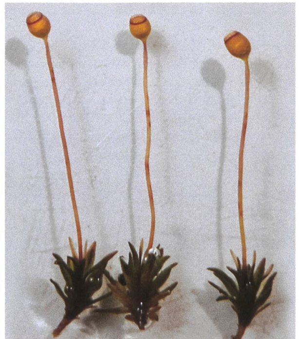
Abbildung 6: links Fundort von Polytrichum nanum in einer Borstgrasweide oberhalb Rieden (offene Stelle in der Mitte) und rechts einzelne Pflanzen.