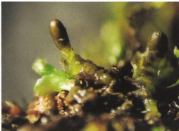
Abbildung 4: Haplomitrium hookeri , vegetative Pflanze (oben) und junge Sporenkapsel (unten).

wächst in der subalpinen bis alpinen Stufe in den Randbereichen von Hochmooren oder an nassen Stellen in Gebirgsnadelwäldern oder Alpweiden, auch im feuchten Sand von Gletschervorfeldern. Im Kanton wurde sie bisher nur einmal am Rand des Hochmoores Hinder Höhi in Amden gefunden. Die Pflanzen sind allerdings sehr klein und darum nicht leicht zu entdecken.