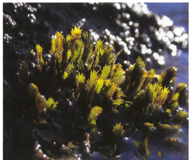
Abbildung 3: Linthkanal mit Niedrigwasser im Winter und halb untergetauchte Pflanzen von Fissidens grandifrons .