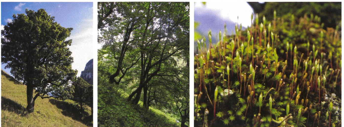
Abbildung 8: Bergahornweide (links), lockerer Ahornbestand (mitte) und Polster von Tayloria rudolphiana auf einem Ast (rechts).

Die Verbreitung dieser Art in Europa beschränkt sich auf die Nordalpen in Höhen zwischen etwa 1'200 und 1'800 Metern zwischen dem Salzburgerland und dem Berner Oberland. Daneben gibt es vereinzelte Vorkommen in Asien. Mehr als 90 % der bekannten Fundorte liegen in Österreich, Bayern und der Schweiz, die Art gilt daher als europäischer Teilendemit. Sie kommt praktisch ausschliesslich auf den Ästen von alten, locker stehenden Bergahornen vor und ist daher besonders ge-