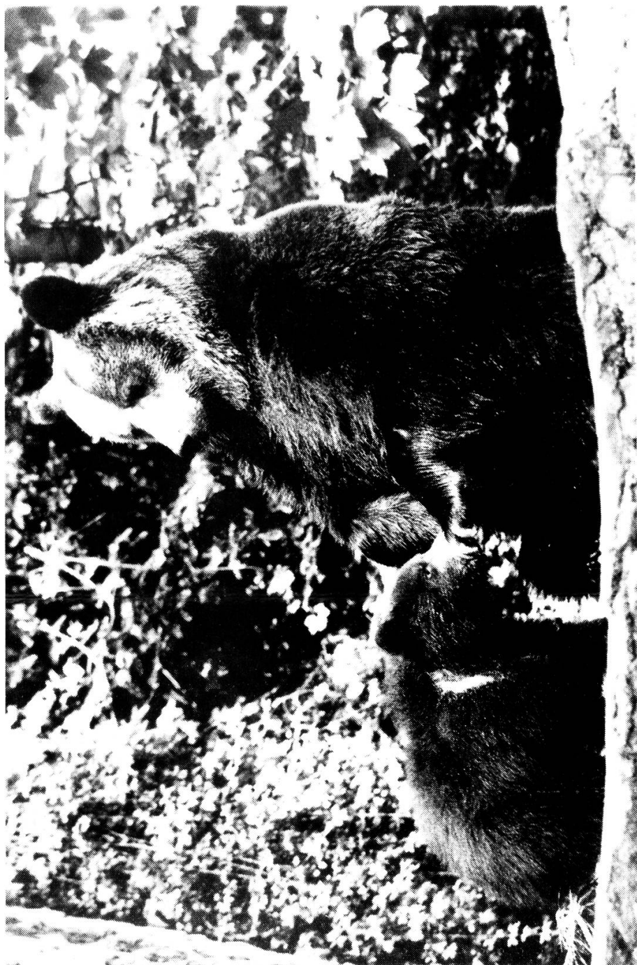
Abb. 1: Nachdem um die Jahrhundertwende der Bär in der Schweiz ausgerottet war, denkt man heute anders und überlegt sich ernsthaft, ob dem Alpenbären nicht doch noch eine Chance gegeben werden könnte.