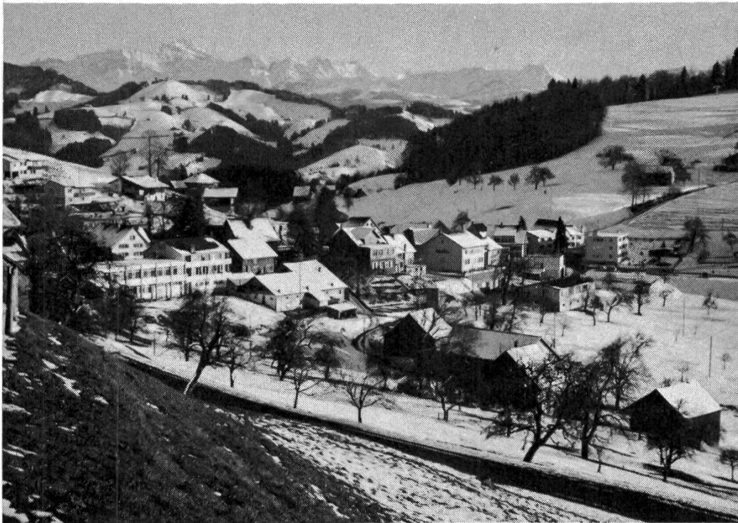
Abb 17: Transfluenzpass von Oberhelfenschwil. Aufnahme von NW gegen das Neckertal (Bildmitte). Rechts mit Moräne ausgekleidete Mulde mit Zungenbeckencharakter. In der Bildmitte fluvial überprägte Passlücke mit Abfluss gegen das Neckertal.

lag die Zunge des Neckergletschers in 800 - 810 m, was durch Rundhöcker und kleine randliche Rinnen einigermaßen belegt ist (4.4.2).