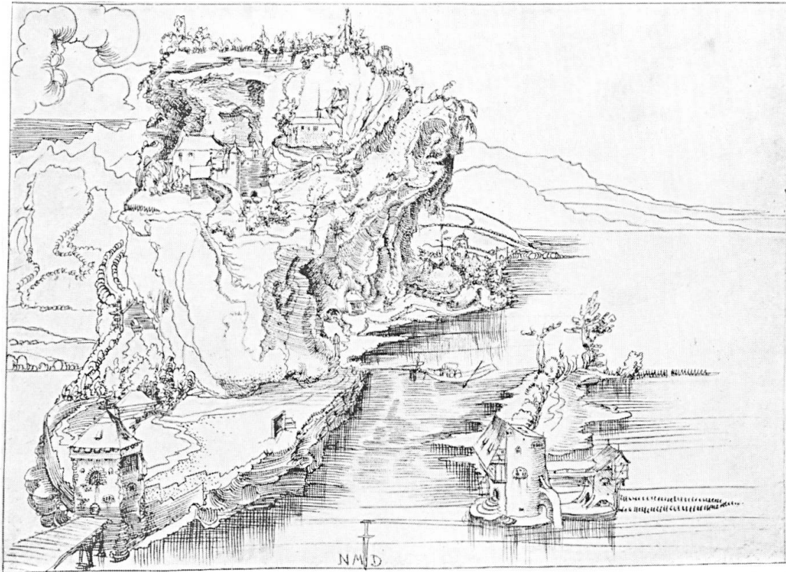
Niklaus Manuel Deutsch: Felsiges Vorgebirge mit Landzunge und Brücke