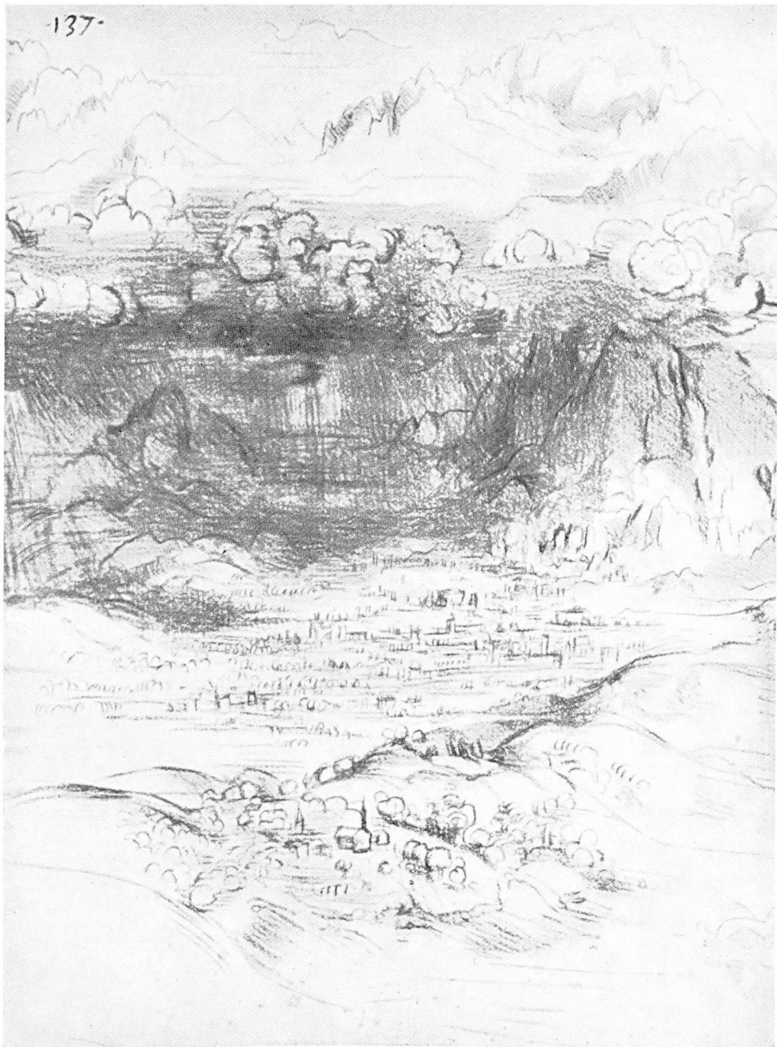
Lionardo da Vinci: Landschaft mit Regenschauer