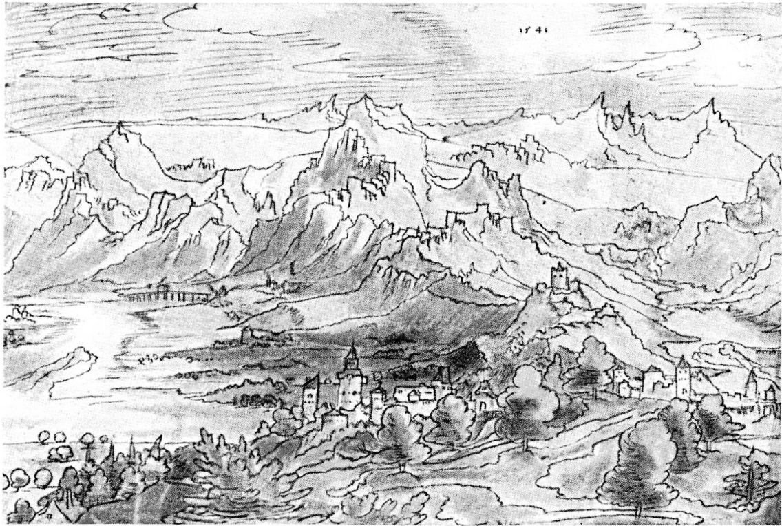
Wolfgang Huber: Alpenlandschaft, Zeichnung 1541, London