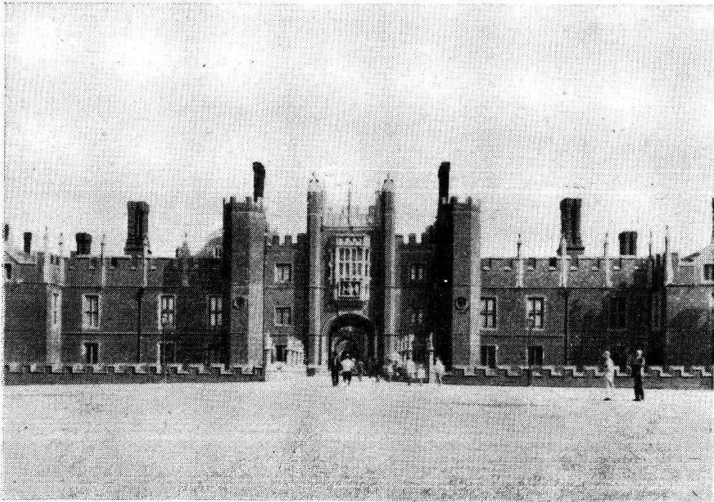
Abb. 3. Alter Königspalast Hampton Court bei London.