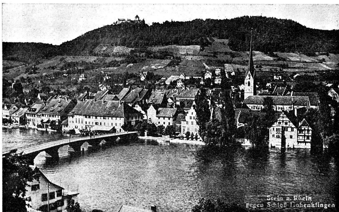
Blick auf Stein a. Rhein und das Schloss Hohenklingen.