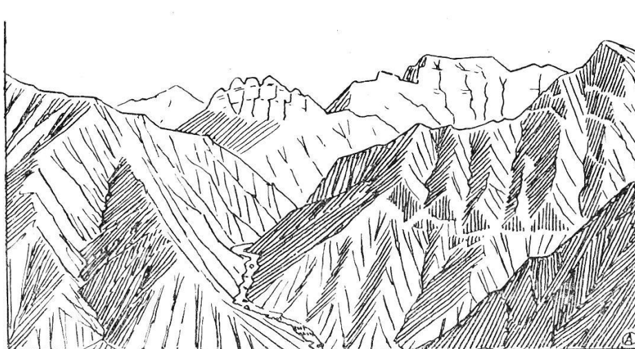
Fig. 1. — Relief jeune.

L'ensemble de la région est passablement abaissé. Les cours d'eau, ayant leur profil d'équilibre, font de l'érosion latérale, des vallées à