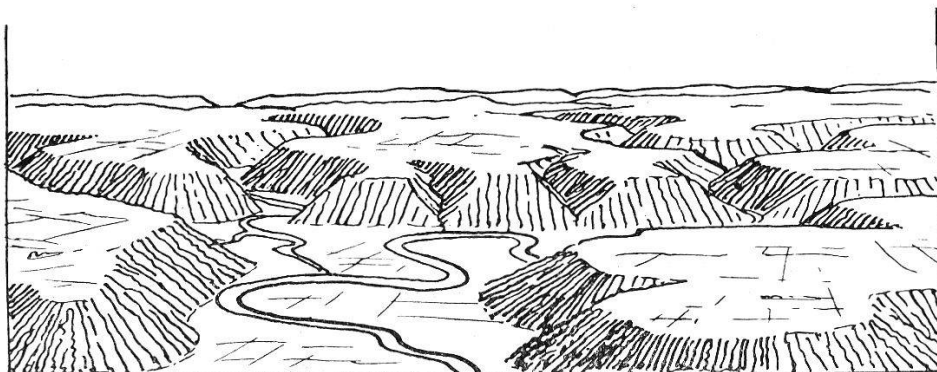
Fig. 4. — Relief à deux cycles d'érosion.

Après la formation d'une pénéplaine, la région s'est soulevée et les cours d'eau ont dû creuser à nouveau en enfonçant leurs méandres dans la pénéplaine. Ici ils ont creusé assez pour pouvoir commencer de l'érosion latérale.