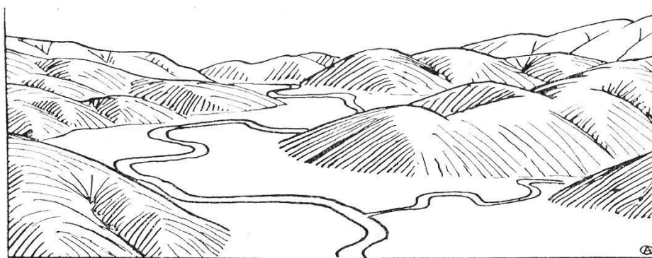
Fig. 2. — Relief mûr.

L'ensemble de la région est passablement abaissé. Les cours d'eau, ayant leur profil d'équilibre, font de l'érosion latérale, des vallées à