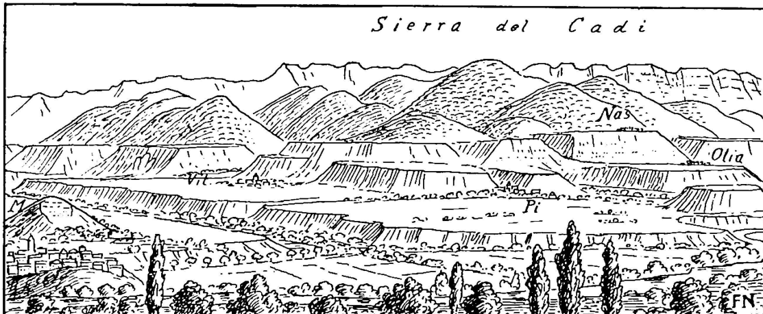
Fig. 4. Blick auf die Terrassenlandschaft südw. von Bellver (links) im Tal des Segre. M = Tertiärhügel Monterros. Vit. = Vitella (zu Seite 122).

Der Gletscher von Angoustrine hatte sein Nährgebiet, wie eben angegeben, auf der Ostseite und den Plateaus der Carlitte-Gruppe, und er setzte sich aus drei Zuflüssen zusammen, von denen der östlichste nichts anderes war als eine Abzweigung des Tet-Gletschers unterhalb des Marais de Bouillouse; er durchströmte ein typisch trogförmiges Tal; der mittlere Zufluss kam vom Seenplateau westlich von La Bouillouse, und der westlichste entstammte mehreren Karen südlich des Pic Carlitte. Der etwa 12 km lange Gletscher endete in 1300 m Meereshöhe und bildete die beiden mächtigen, südwärts verlaufenden Moränenwälle, die sich bei Angoustrine vereinigen. Im Maximum der Würmeiszeit dürfte die Schneegrenze für diesen wie für den Tet-Gletscher in 2100—2200 m Meereshöhe gelegen haben. In dem vom Angoustrine-Gletscher und von seinen Zuflüssen bedeckten Gebiet, und zwar