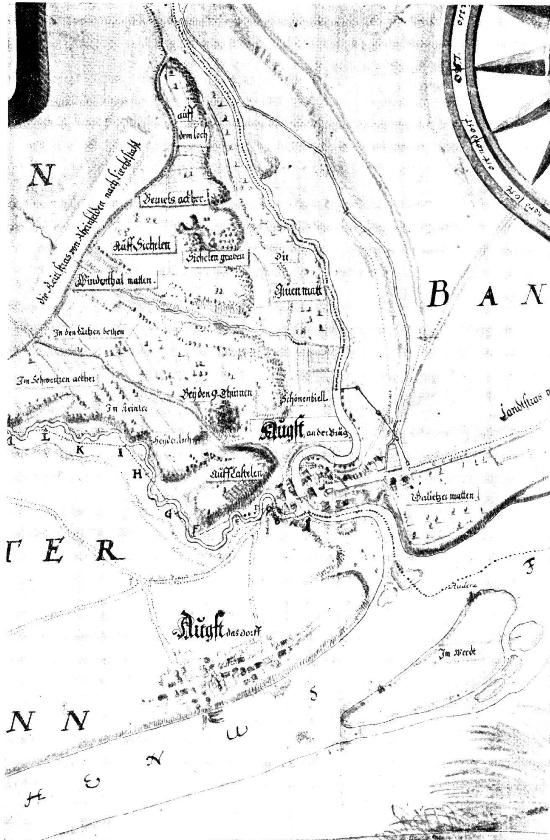
Karte 1. Augst mit Ergolzmündung. G. F. Meyer, 1680. Maßstab ca. 1:17,300, im Original 1:10,000.