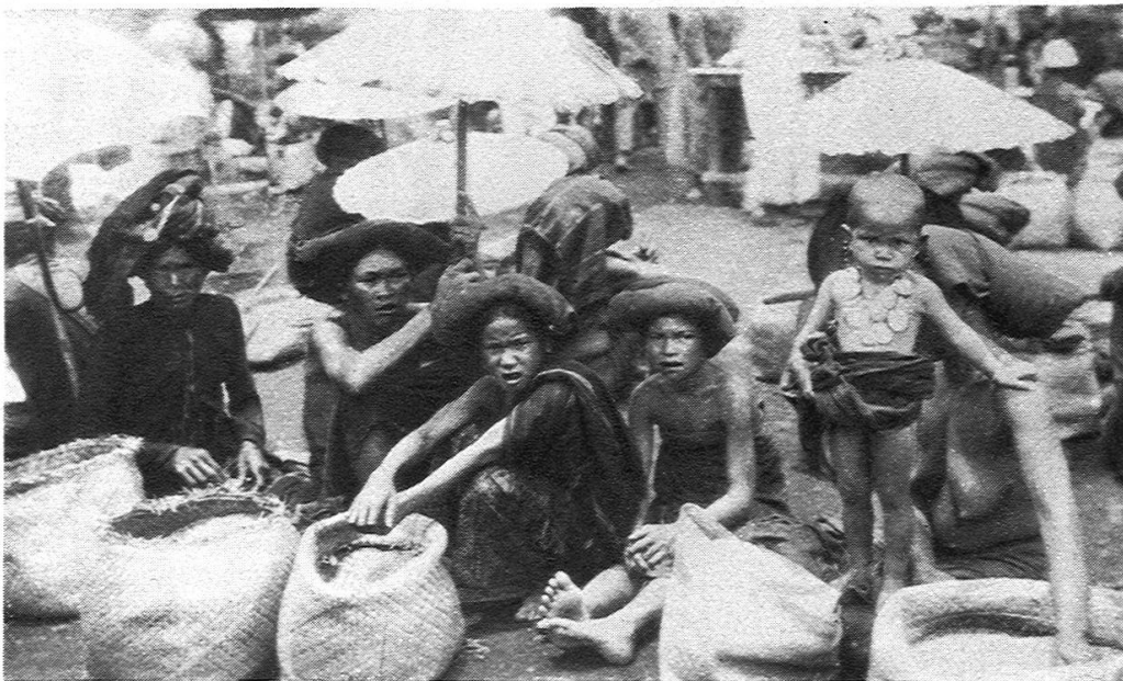
Fig. 6. Markt in Brastagi (Karoland). Verkauft wird Reis. Die Frauen tragen kissenartige Kopftücher, Schirme aus chinesischem Papier.