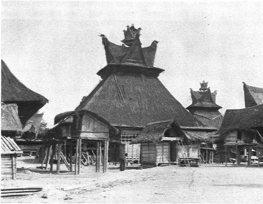
Fig. 5. Karo-bataksches Dorf. Auf dem Platz Reisspeicher (rechts) und Hühnerställe (links).