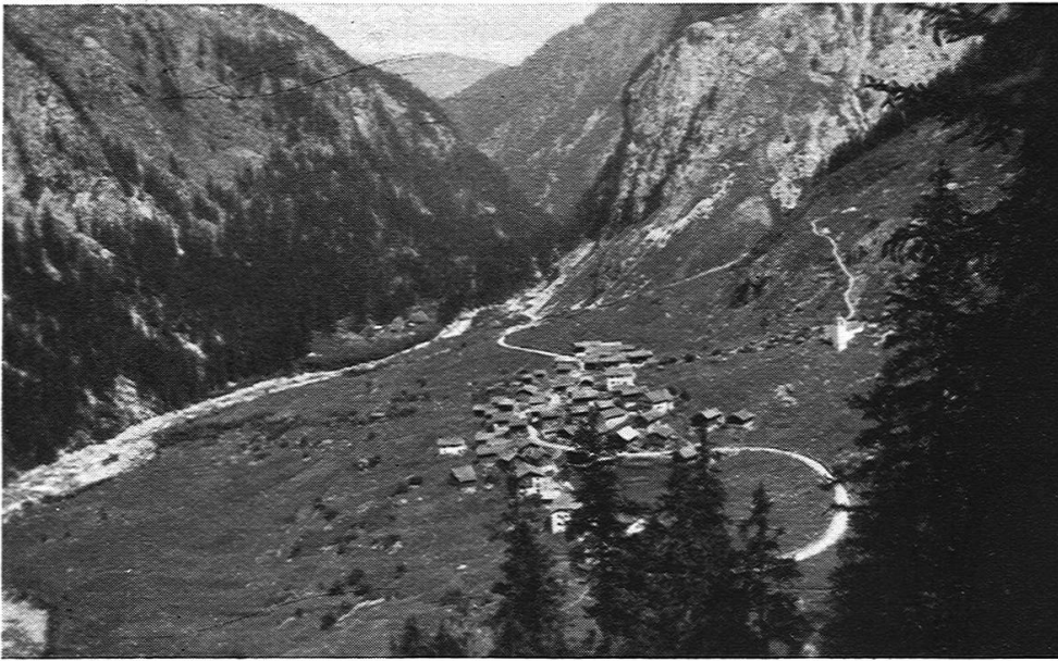
Fig. 1. Dorfbild von Süden aufgenommen.

1 ehemalige Schmiede sind schon längst verlassene Wohn- und Arbeitsstätten. Im Jahre 1705 1) stürzte ein grosses Stück des Sutt Foinagletschers am Nordhang des Piz Grisch oder Fianells zu Tal und staute den Mühlebach. Dann durchbrach das Wasser das Hindernis, stürzte gegen das Dörfchen hinunter und verheerte, gewaltige Steine mit sich führend, die Matten westlich desselben. Den Fluten fiel eine Säge am Mühlebach zum Opfer. Im Jahre 1832 überschwemmte auch der Ferrerabach, dessen Bachbett vorher viel höher gelegen war, den nördlichen Teil des Dörfchens, ein Wohnhaus und zwei Ställe mit sich reissend.