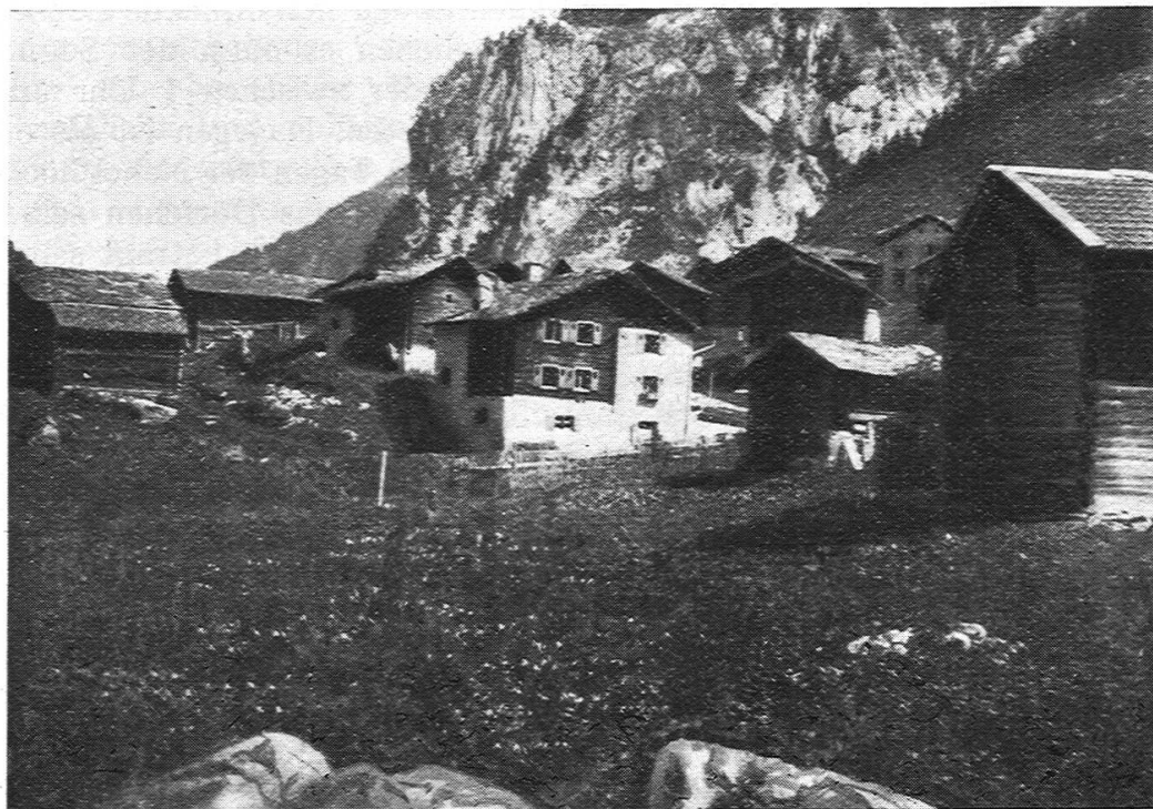
Fig. 4. Mitte des Bildes Pension Grischott-Etter.

in die Stube, anderseits in die Küche, von wo — wenn nicht vom Gang aus — eine steinerne oder hölzerne Treppe in den Keller hinunter führt, der meistens nur unter der Stube liegt. Die Küche befindet sich direkt auf ebener Erde. Der Küchenboden besteht in vielen Häusern aus Holz. Der Rauch und Dampf in der Küche 1) findet durch den offenen Rauchfang den Weg in das Kamin, das bei manchen Häusern mit einer Steinplatte beschwert ist. In der Stube steht der oft aus Granit bestehende, längs der Kanten mit Holzleisten ver-