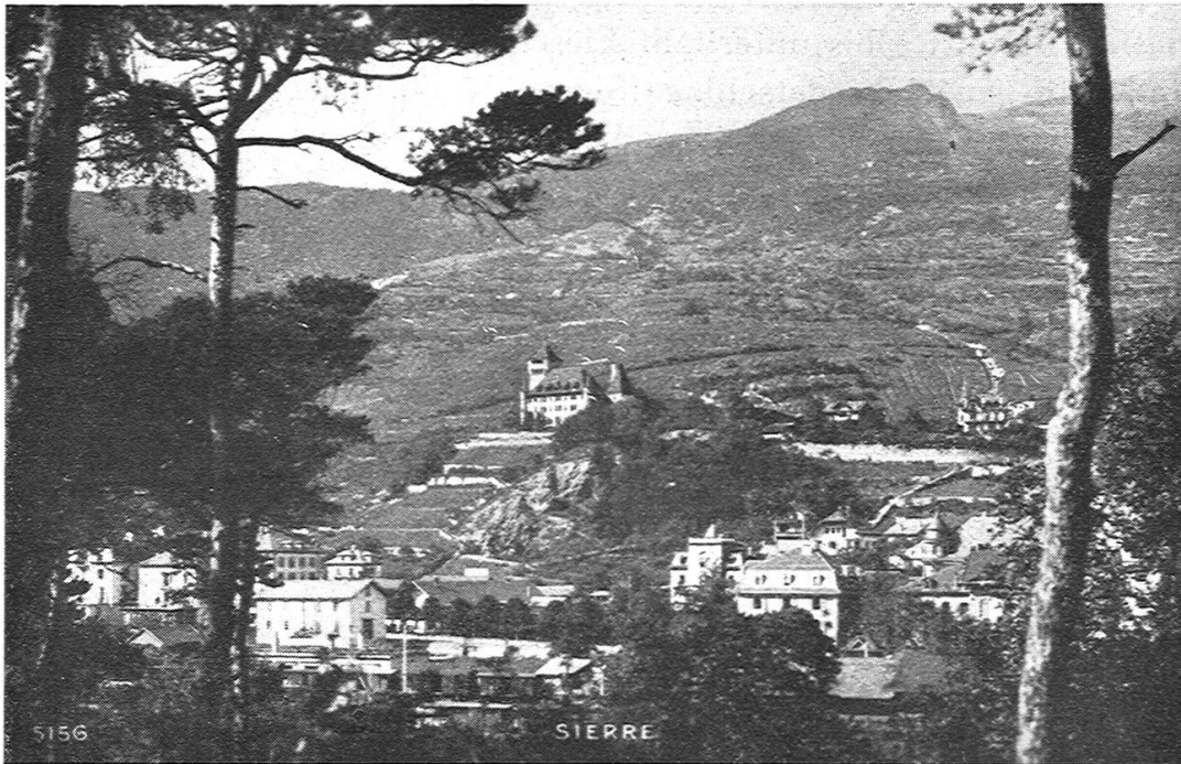
Fig. 1. Siders mit dem nördlichen Berghang.

Verbandes, der Schweizerische Geographielehrerverein, hat den geringsten persönlichen Kontakt, da seine 370 Mitglieder über das ganze Land zerstreut sind. Der von ihm in Verbindung mit der Firma Kümmerly & Frey, die dafür Opfer bringt, gegründete «Schweizer Geograph» bildet das Band, das alle Mitglieder umschlingt. Ihn auszubauen und ihm neue Freunde zu werben, wird unsere stete Sorge sein. Die Geographische Gesellschaft Bern und die Geographisch-Ethnographische Gesellschaft Zürich referieren regelmässig in unserer Zeitschrift über ihre Vorträge und Exkur-