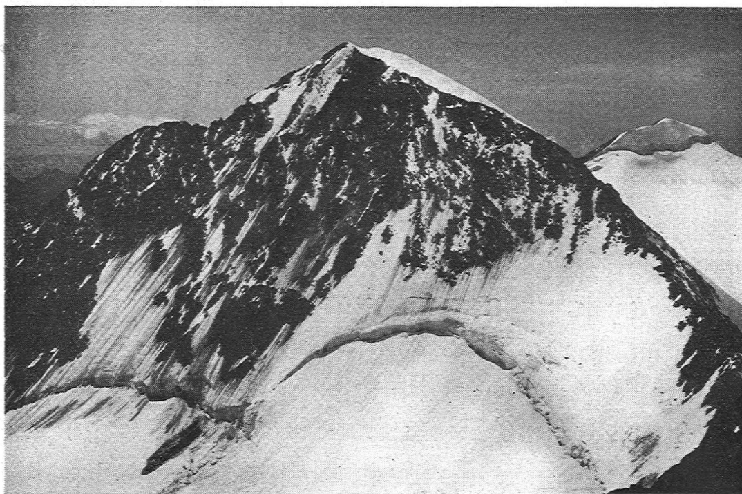
Abbild. 4. Verwitterung und Bergschrund am Piz Zupo.

schierzunge entstanden sein kann oder abgelagert worden ist, sondern dass seine streifenartige Erscheinung tatsächlich mit der Struktur des Gletschers in engstem Zusammenhang steht. Dazu kommt die Tatsache, dass bei vielen Gletschern die Schmutzbänder der untersten, dem Gletscherende am nächsten liegenden Eisschichten nicht nur Sand und Staub, sondern auch grössere Gesteinstrümmer aufweisen. Teils rühren sie, infolge von Abscheurungsvorgängen, aus der Grundmoräne her, teils stammen sie