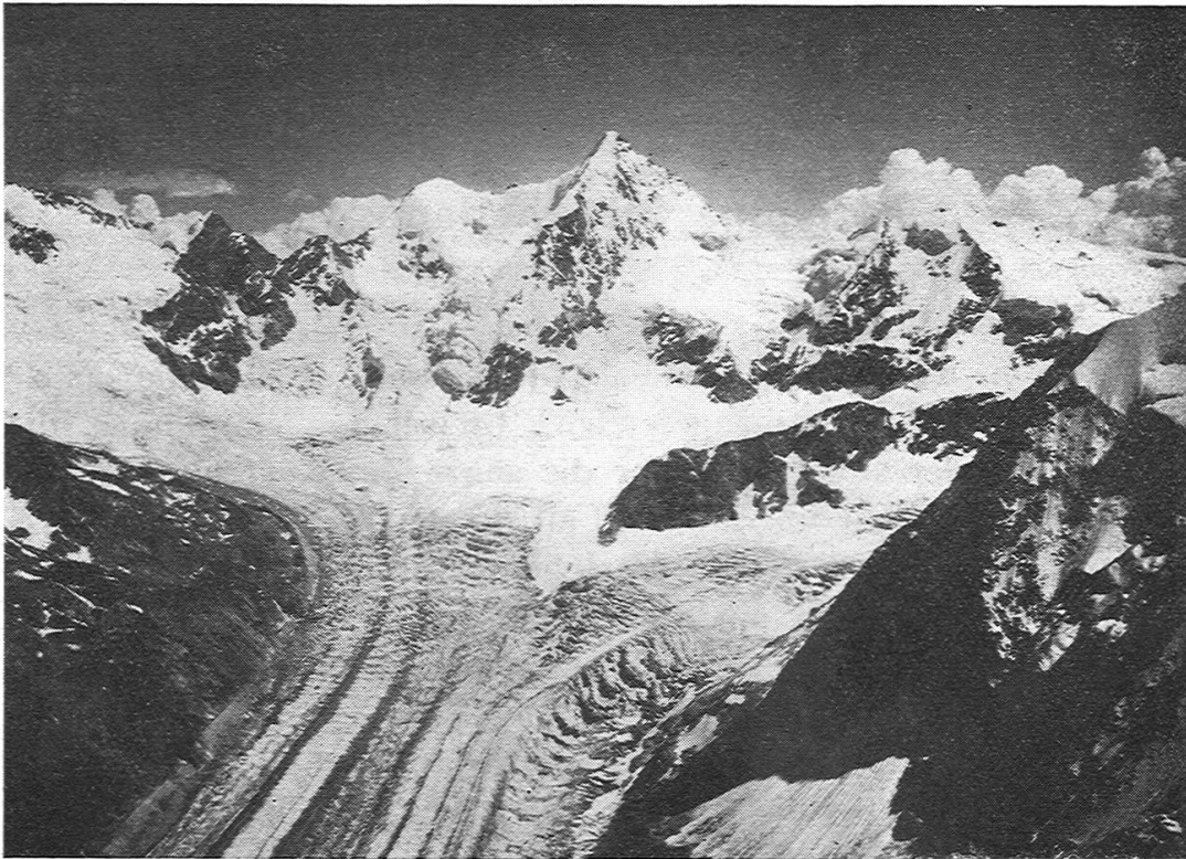
Abbild. 2. Blick auf den Zinalgletscher von den „Bouquetins“.

streifen gletscherabwärts mehr und mehr verblassen, undeutlicher werden müssten, da das oberflächlich ab rinnende Schmelzwasser auch den nur oberflächlich auflagernden Staub mehr und mehr wegschwemmen würde. Allein dies trifft nicht zu; man hat eher den Eindruck, dass die Ogiven gletscherabwärts deutlicher ausgeprägt sind als weiter oberhalb. Dies zeigt sich namentlich auf einer prächtigen, von Kapitän Spelterini gemachten Ballonaufnahme des « Mer de Glace », die bei Wehrli in Kilchberg