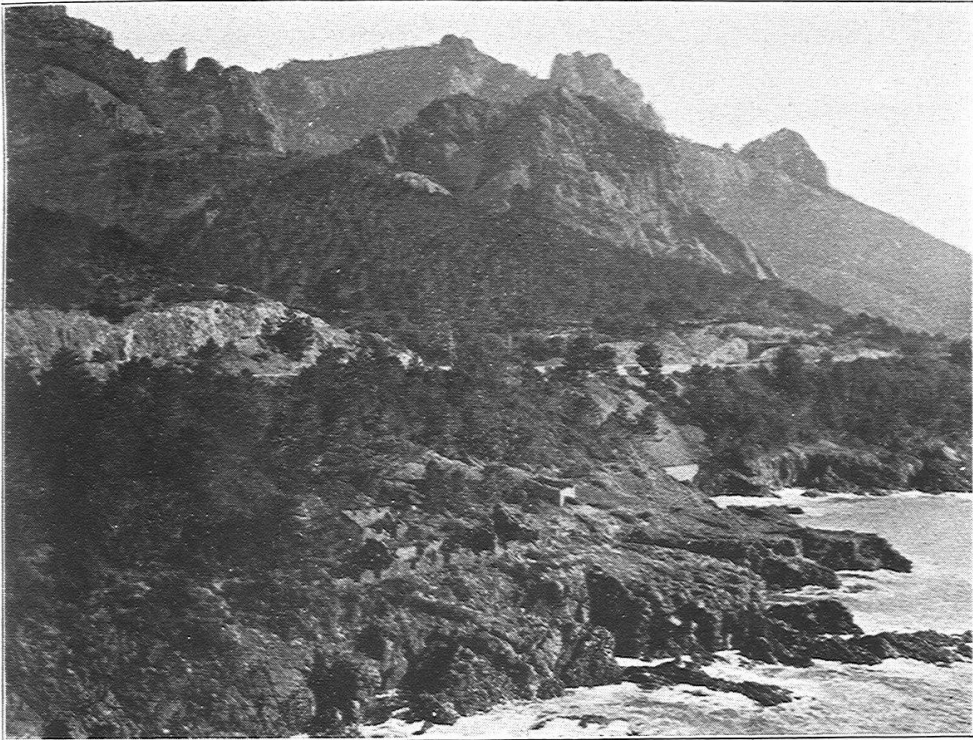
1. Steilküste des Estérel (Riviera).