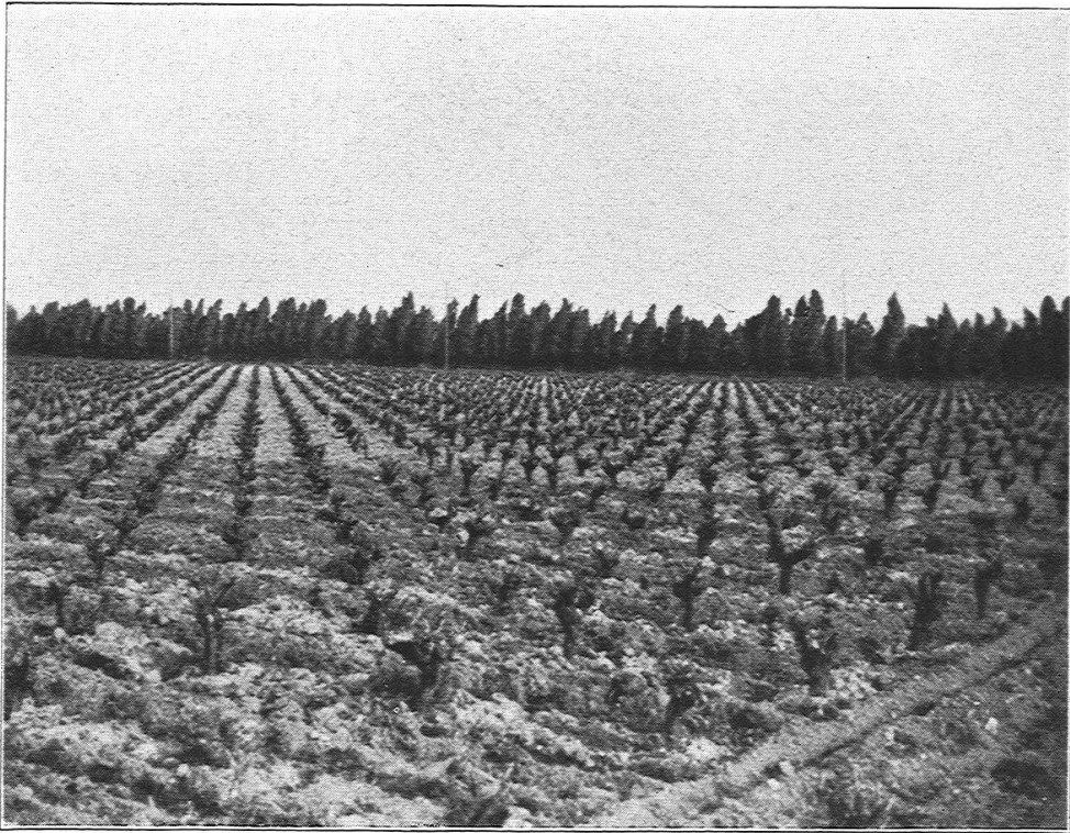
3. Weinberg in Südfrankreich.