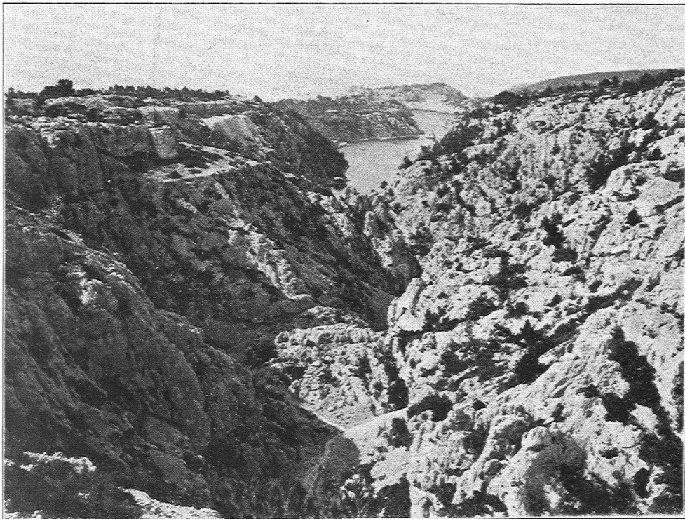
2. Karstlandschaft an der Küste östl. Marseille.