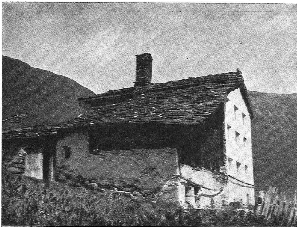
5. Wohnhaus No. 22 in Oberjuf. Links alter, rechts neuer Hausteil. («Höfli», d. h. vorgezogener Hauseingang.)