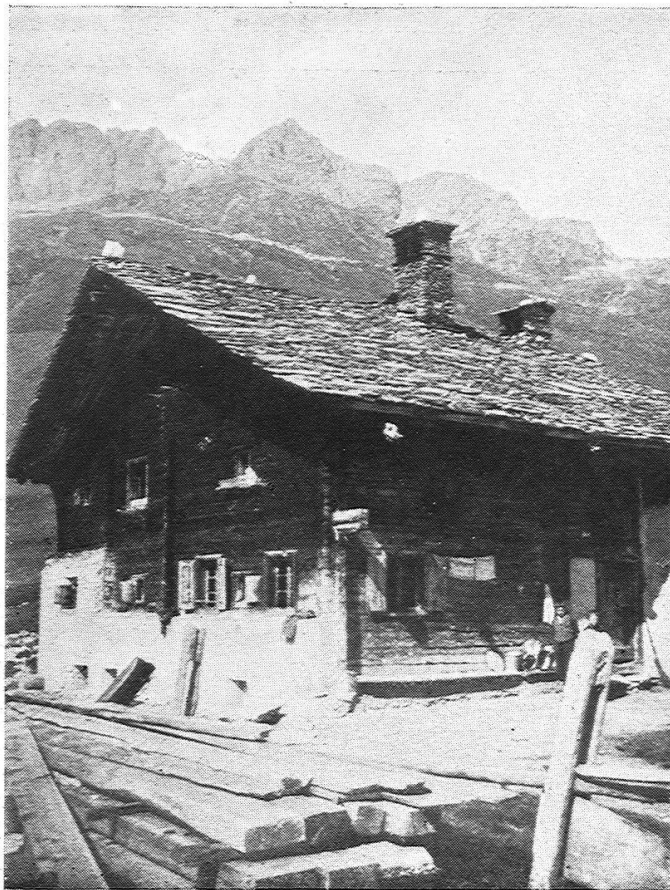
4. Wohnhaus in Bregalga, unterhalb Juf. Alter Haustypus. (Beachte die Mauerverkleidung an der Vorderfront, die kleinen Fenster mit «Tütschi», die Dachsteine).