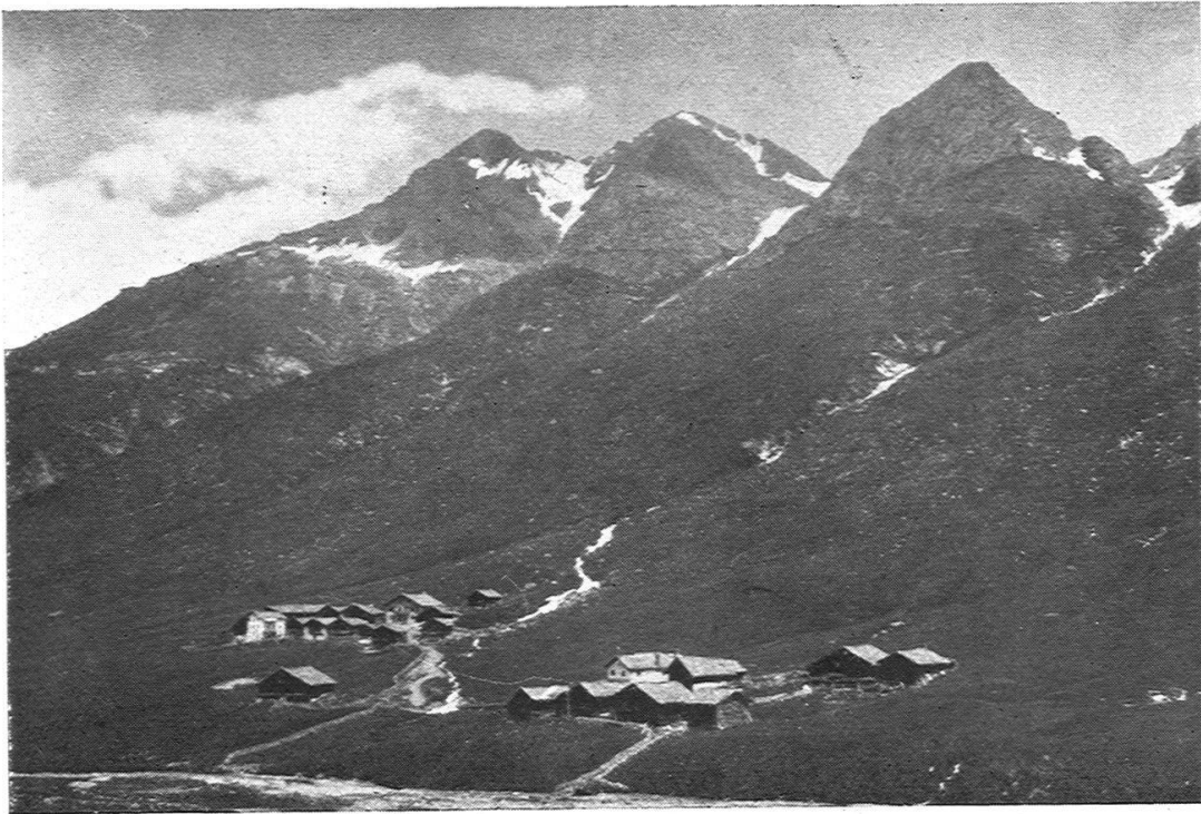
1. Juf von SSE