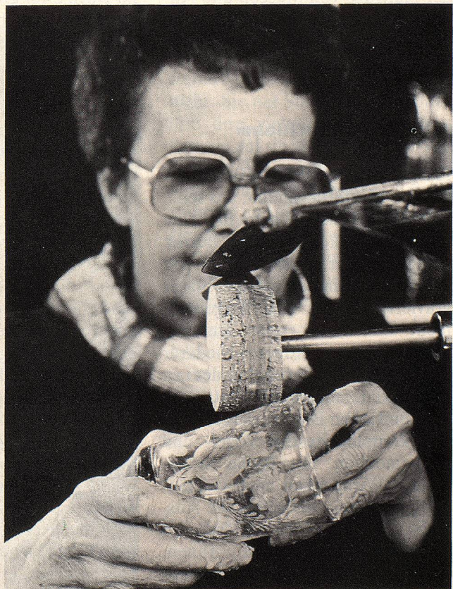
Mit Kork- und Bleirädern wird die fertige Gravur aufgehellt oder poliert