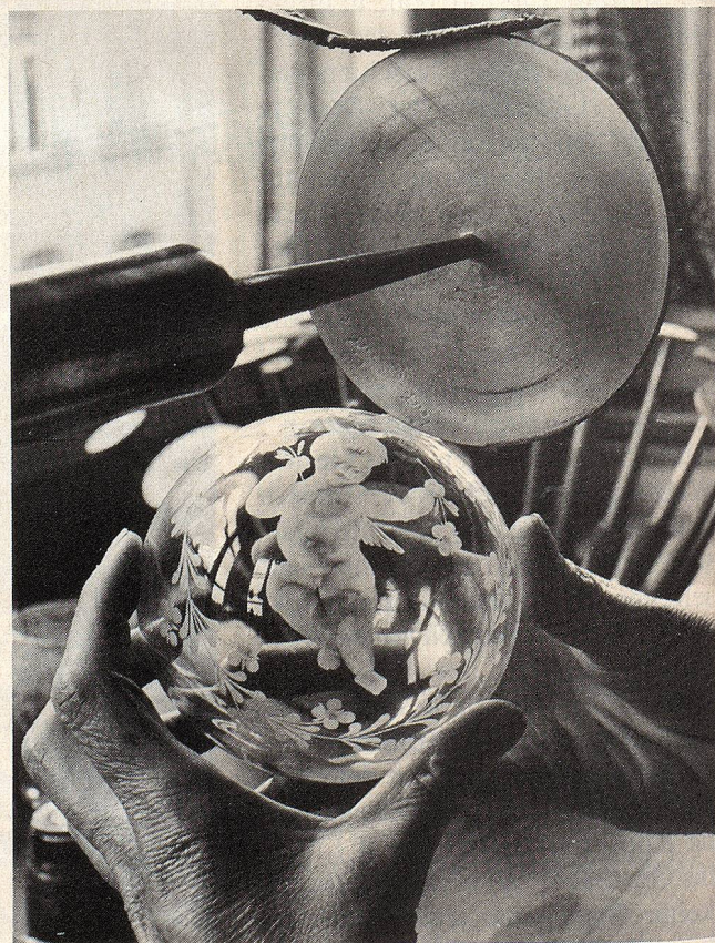
Das Kupferrad wird zum Schleifen mit Schleifmasse bestrichen. Die Künstlerin sieht oft kaum, was sie macht, weil das Glas ganz verschmiert ist