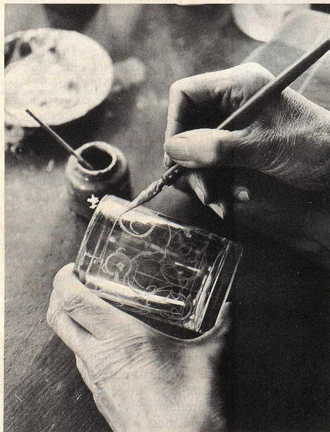
Einteilen und Vorzeichnen kann man auf Glas mit Deckfarbe, der einige Tropfen Leim beigemischt werden