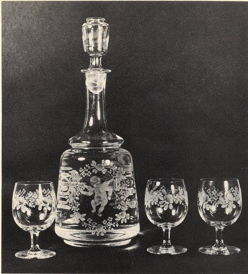
Frau Walz liebt es, alte Flaschen und Gläser zu gravieren. Sie hat eine enge Beziehung zur Tradition der Glasschleiferei

der Aufträge von Museen und Antiquaren, die sie bitten, in alten Schliﬀscheiben die zerbrochenen Teile zu ersetzen.