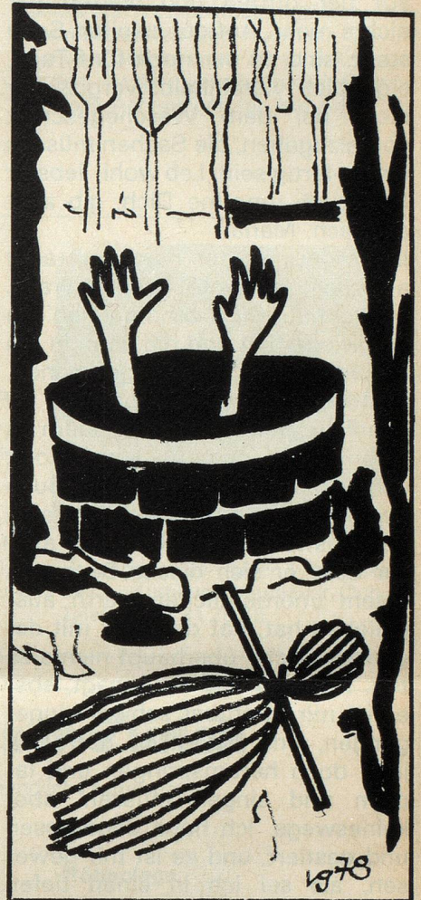
Den ganzen Nachmittag habe ich versucht, aus dem finsternen Brunnen zu steigen

puppe, so gedrückt und gequetscht, so widerlich, und schliesslich habe ich überhaupt nur noch geredet, damit er den Hörer hinwirft, damit Schluss ist, Schluss mit dem allen. Und weil er den Hörer nicht hingeworfen hat, bin ich einfach still gewesen, ganz still, die Muschel