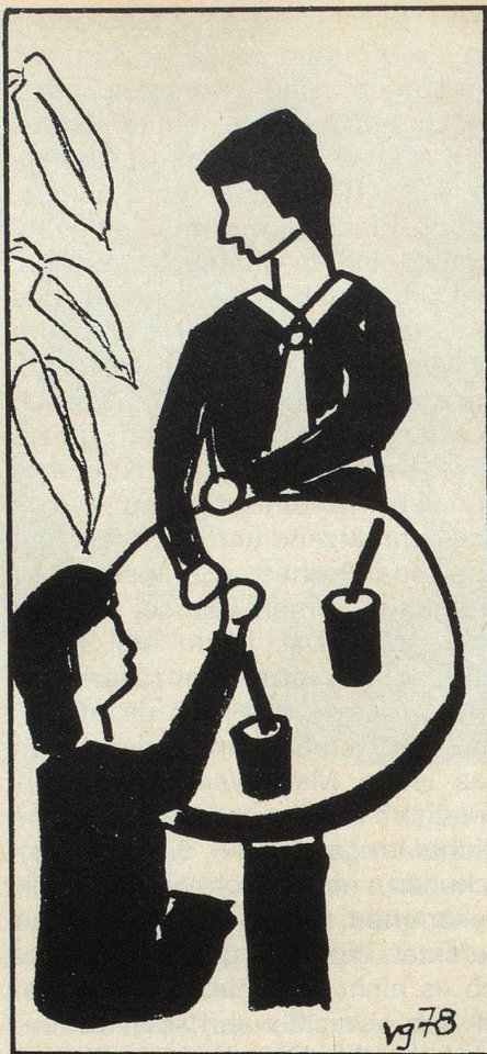
Vielleicht kam er zu spät, weil er noch mit ihr zusammen in einer Bar sass und etwas trank

Indessen hat das Telefon geläutet, aber nur einmal, wie es manchmal vorkommt, wenn einer merkt, dass er die falsche Nummer gewählt hat und den Hörer ganz rasch wieder niederlegt. Es ist mir aber dabei eingefallen, dass es leicht möglich war, dass der Felix vom Büro anruft, und warum habe ich denn plötzlich Tränen in den Augen, aber das macht nichts, er sieht mich ja nicht. Er hört nur meine Stimme, und meine Stimme ist ganz sanft und fröhlich. Was sagst du? Du kommst nicht zum Essen? Ob das was macht? Aber natürlich nicht. Gar nichts macht das. Ich bin sogar froh. Ich hab' noch zu bügeln, und ich wollte auch später gern zum Friseur. Nein, ich habe gar nichts Besonderes vorbereitet. Ich habe noch nicht einmal angefangen zu kochen. Geht es dir gut, Liebster? Mir? Wunderbar. Es ist ja so ein schöner Tag. Auf heute abend, ja... Ja, so wollte ich es machen, ganz leicht, ganz frei. Und so wollte ich auch mit ihm reden, wenn er kam. Eigentlich hätte er ja jetzt schon da sein müssen. Es war halb zwei Uhr vorbei, und er kam immer eher pünktlich nach Hause. Er hatte auch immer grossen Appetit mittags, und er wusste, dass es an dem Tag Schnitzel gab, die er sehr gern ass. Aber vielleicht wusste er das