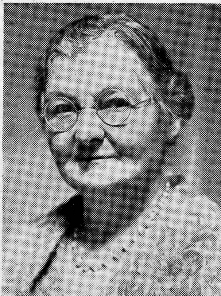
Miss Margaret Bondfield