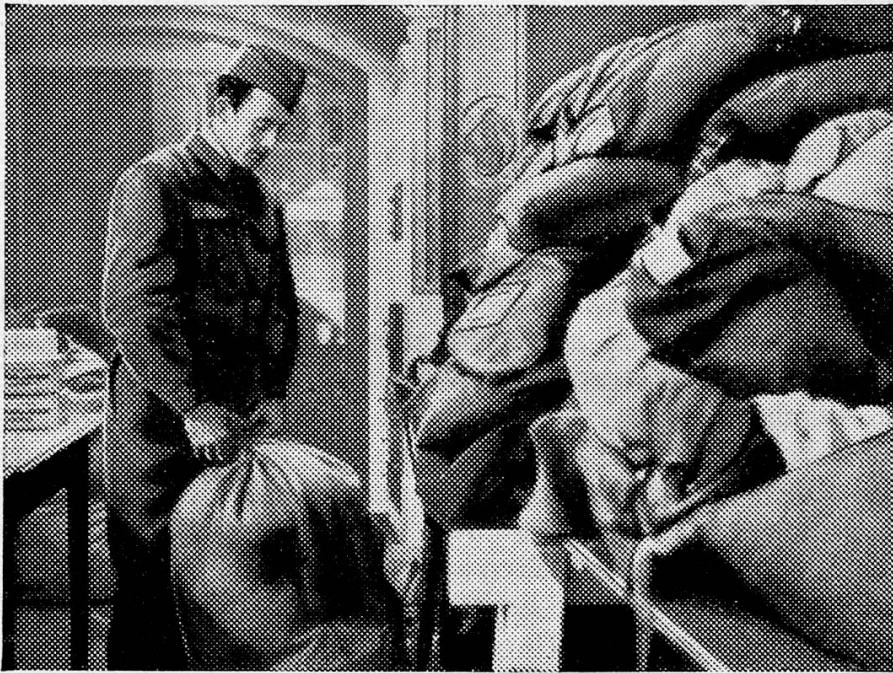
In der Kriegswäscherei Bern

« Weil ich niemand mehr besitze, der mir die Wäsche waschen kann, bin ich gezwungen, Sie anzufragen, ob Sie gewillt sind, die Wäsche zu besorgen. Nach langer Krankheit kam ich zurück in die Festung, wo ich meine Wäsche in ergrautem Zustand fand. Um neue Wäsche anzuschaffen habe ich kein Geld, weil ich vor dem Aktivdienst arbeitslos war. »