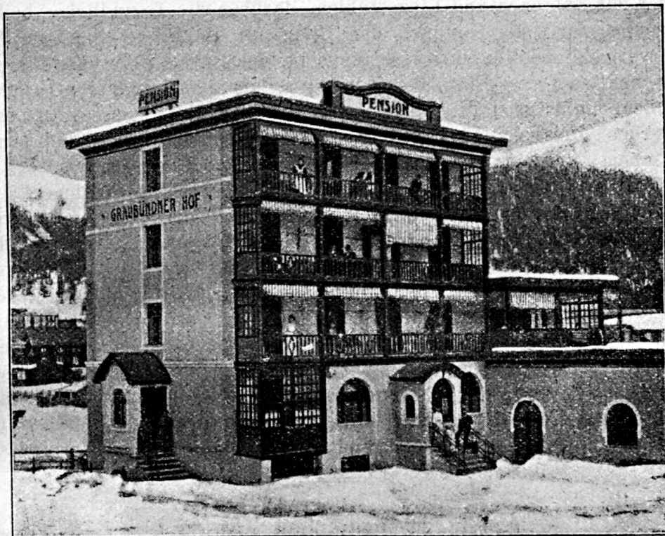
Das Volkshaus und Mädchenheim der Sektion Davos-Platz

Denn wenn man weiss, wie notwendig in solchen Fällen ein Aufenthalt in Höhenklima und wie wunderbar die Heilwirkung unserer Höhensonne im Anfangsstadium der Krankheit sein können, dann hatte man keine Ruhe mehr, es