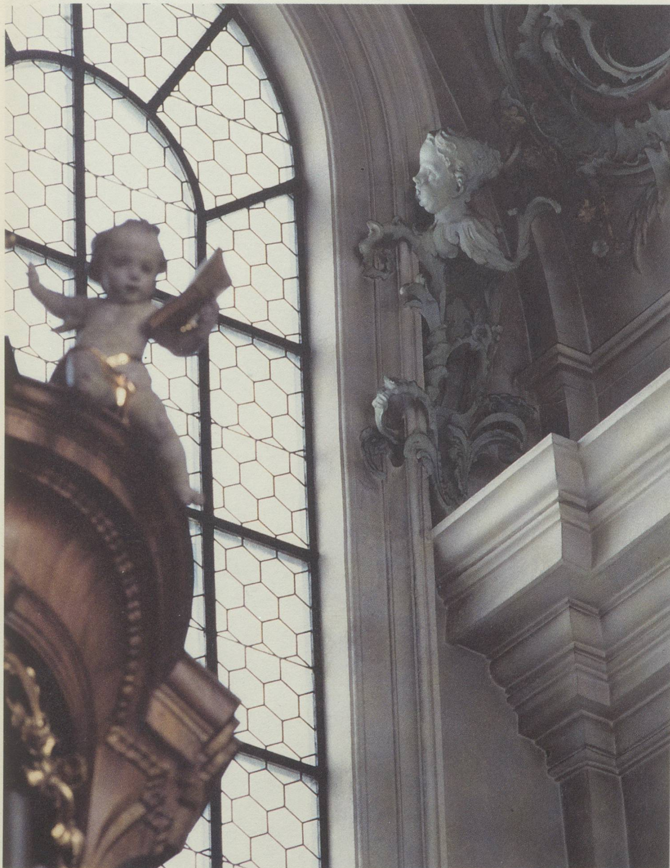
Der Engel (rechts oben) im Seitenschiff des Chors in der Kathedrale St. Gallen.