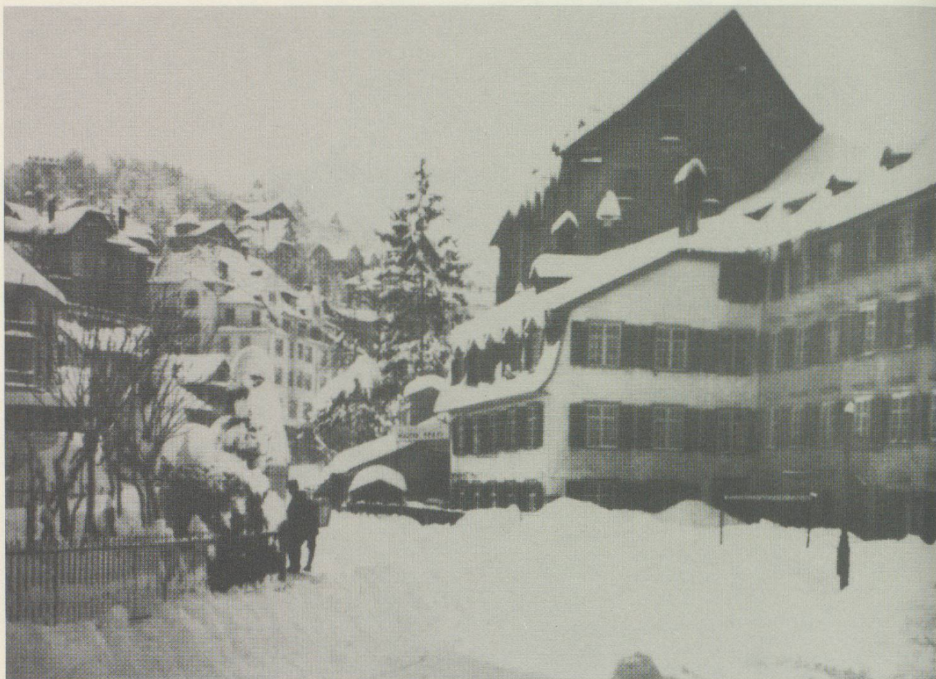
Moosbruggstrasse, um 1890