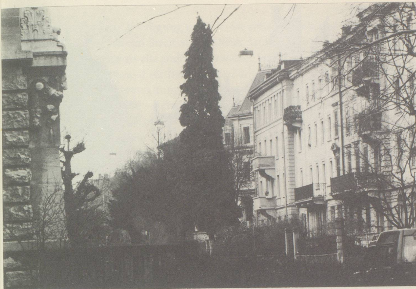
Im geschützten Ortsbild spielen viele Elemente eine Rolle: Vorgärten, Bäume, Mauern, Gartentore, Treppen, Balkone, Strassenbeläge . . . Als Beispiel: Notkerstrasse im zentrurnahen Museumsquartier.