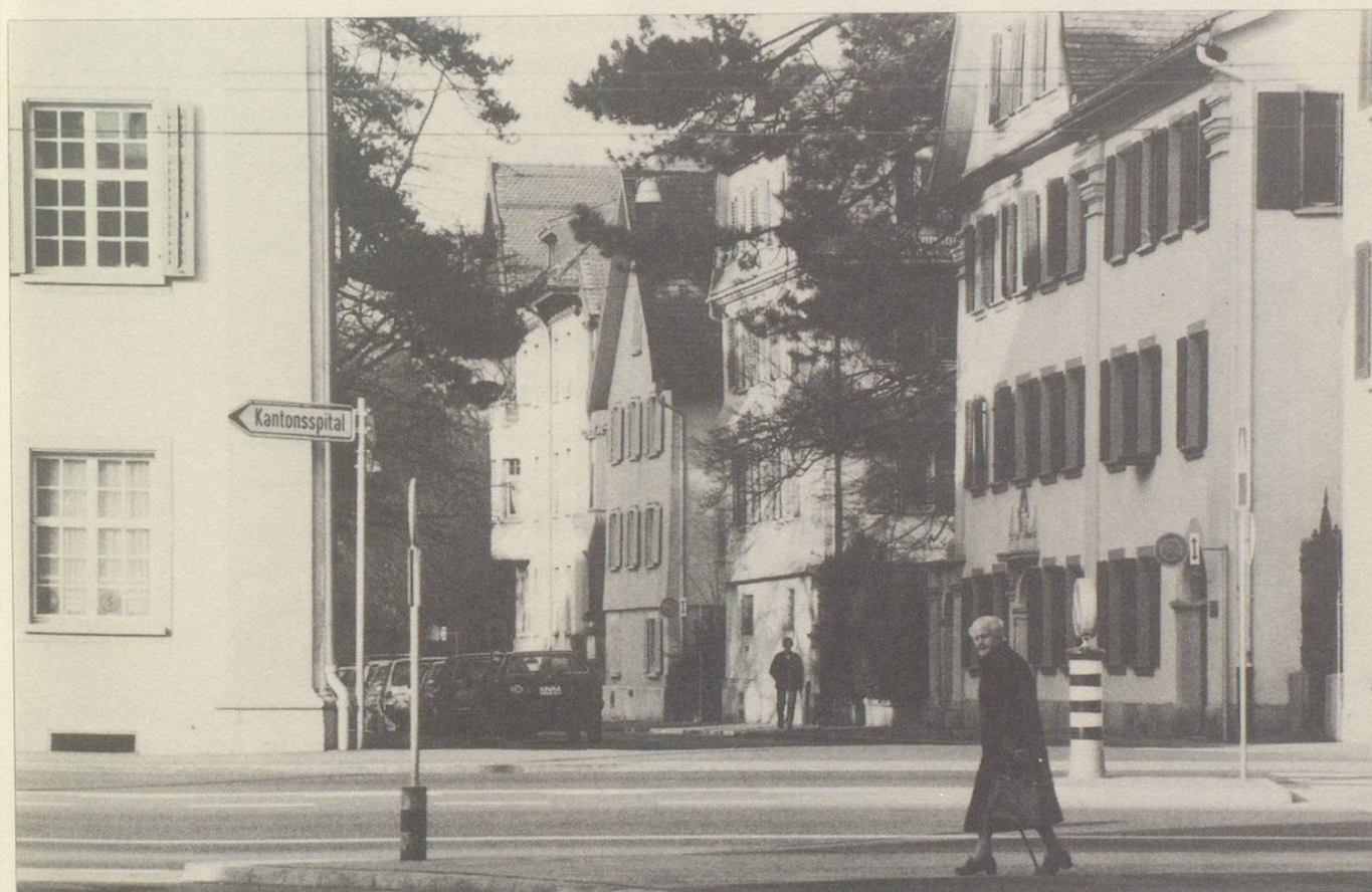
Die herrschaftlichen barocken Häuser an der Greithstrasse erinnern an die äbtische Vergangenheit.