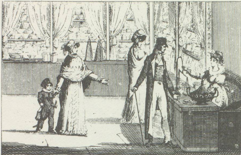
Le Confiseur .