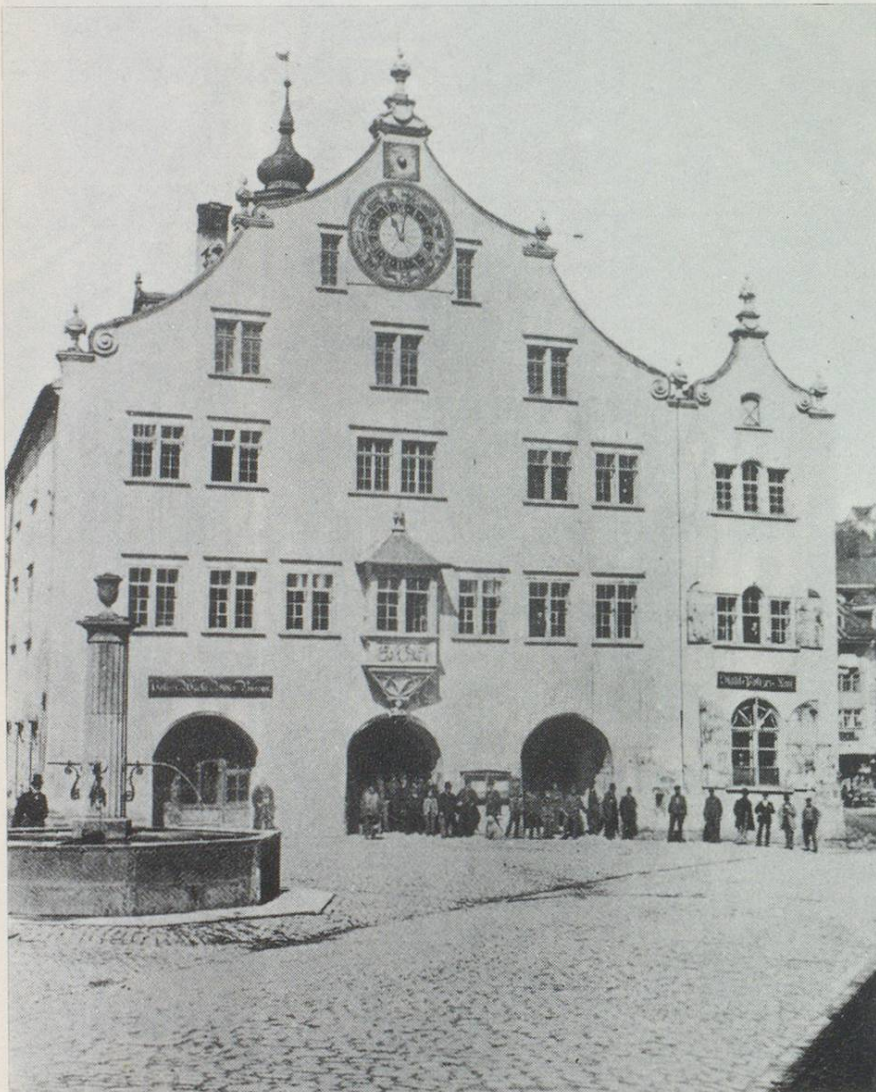
Das alte Rathaus, abgebrochen 1877. Das Türmlein mit der Feuerglocke und die Mondphasenuhr wurden damals auf das Kaufhaus «verpflanzt».