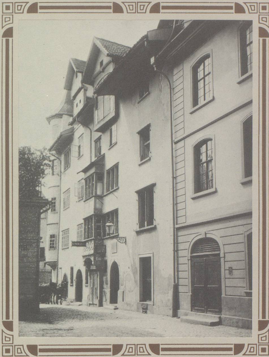
Die Hinterlauben in St. Gallen zur Zeit der Jahrhundertwende. Das Vadianhaus (mitte) ist heute Sitz des Heimatwerks.