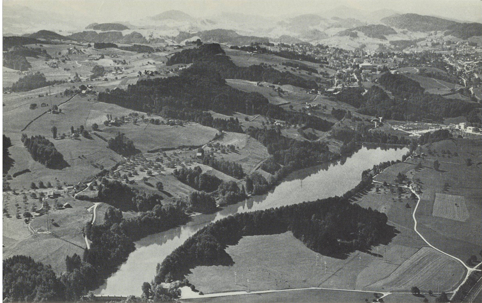
Vor den Toren der Stadt und abseits vom Verkehr bietet sich die Gul... ..