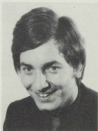
Max Schait Augenoptiker Brillen- und CL-Anpassung