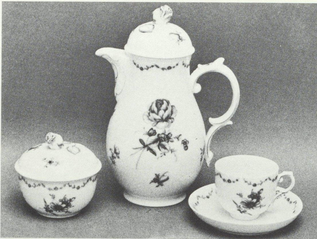
Eine erlesene Auswahl ist unsere beste Verkaufshilfe

In allen Artikeln des täglichen Haushaltbedarfs führen wir ein breites und tiefes Sortiment. Wir wissen, dass der Kunde nur das Gewünschte findet, wenn er in einer grossen Auswahl vergleichen und aussuchen kann.