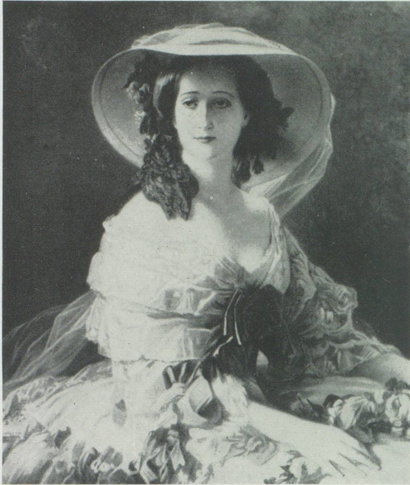
LA BELLE EPOQUE

erreichte ihren Höhepunkt um die Jahrhundertwende, also zur Gründungszeit unserer Firma. Wir waren denn auch schon damals in der Lage, unserer Damenwelt die neuesten Modeschöpfungen vorzuführen, und das verschaffte uns den guten Ruf für auserlesenen Geschmack und beste Qualität.